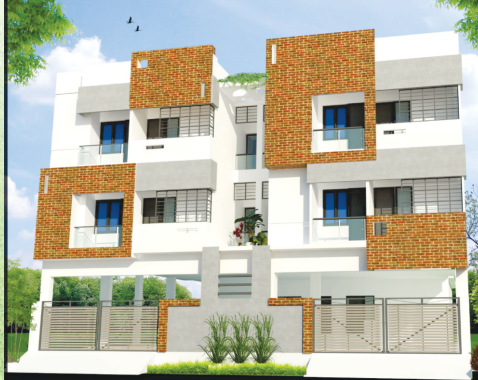
Nethaji Street, Pammal