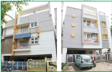
Anna Salai Main Road, Pammal