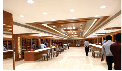
Nalli Jewellers, T.Nagar