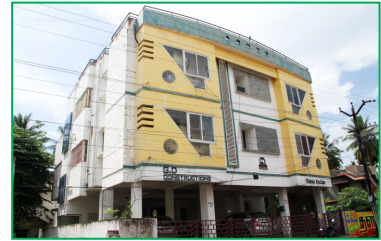
Nalla Thambi Road, Pammal