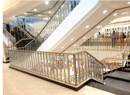
Nalli Fashions Silk Sarees & Jewellers at T.Nagar, Chennai

No.28, (Old No.6), 16th Avenue, Ashok Nagar, Chennai - 600 083. Tel : 044-2474 4556, 2471 7170 Telefax : 044-2474 4556 E-Mail : raasibuilders2001@gmail.com / raasibuilder@yahoo.com