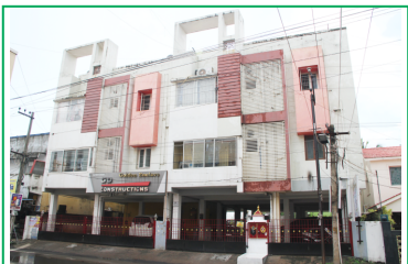
Nalla Thambi Road, Pammal