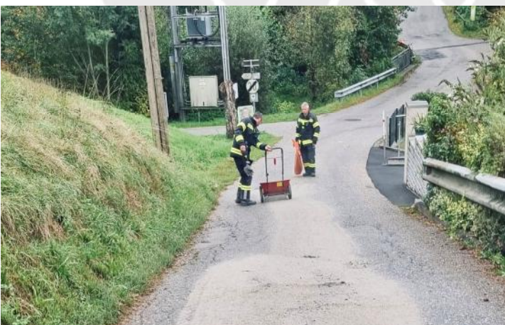
Ölspur am 27. September