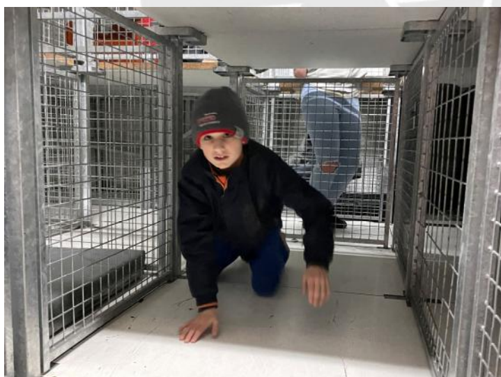
Bewältigen der Atemschutzstrecke