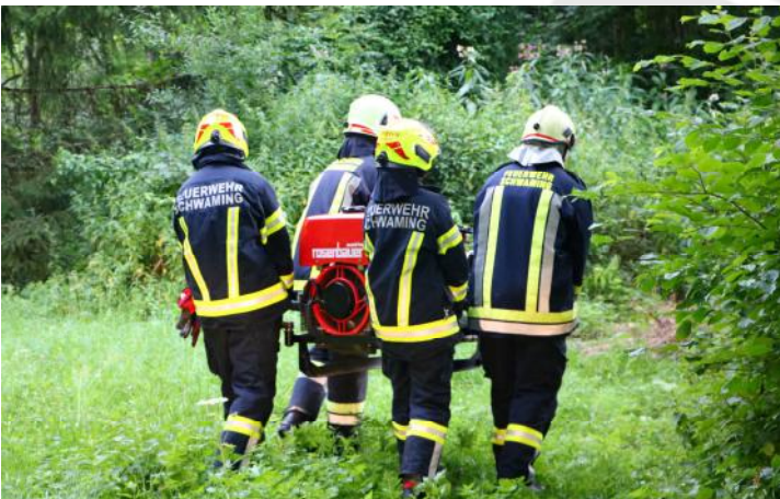
Transport der Tragkraftspritze zur Wasserentnahmestelle