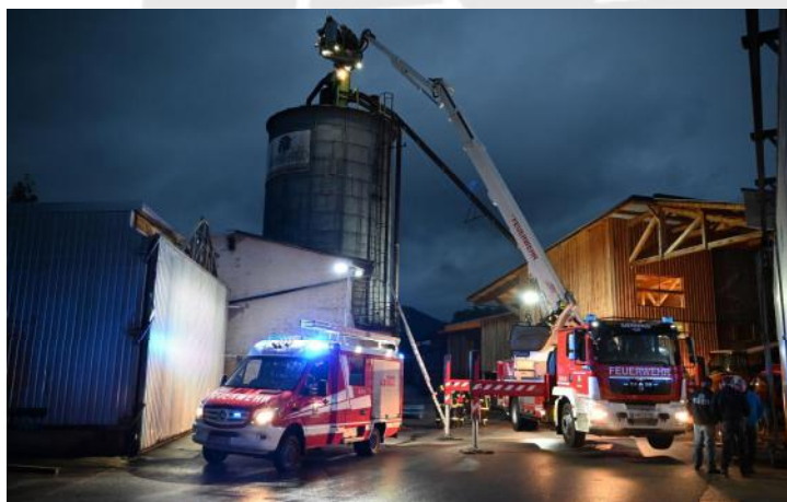
Personenrettung vom Hochsilo

Ein herzlicher Dank gilt dem Abschnittsfeuerwehrkommando Steyr-Land für die Ausarbeitung und Einladung, sowie der Fa. Hanger für die Bereitstellung des Übungsareals und der Verpflegung.