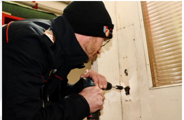
Einbohren eines Ziehschraubens

Ein besonderer Dank gilt Gastausbildner Andreas Zöchlinger für diese wertvolle und lehrreiche Ausbildung, die unser Einsatzspektrum wesentlich erweitert hat!