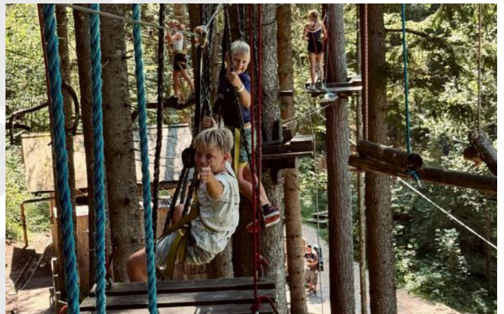
Spaß im Hochseilgarten