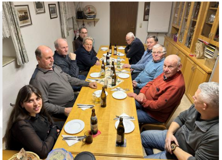
Rege Teilnahme am jährlichen Treffen

Solche Abende sind ein wertvoller Beitrag zur Stärkung des Zusammenhalts zwischen den Generationen innerhalb der Feuerwehr und eine schöne Gelegenheit, die Kameradschaft zu pflegen.