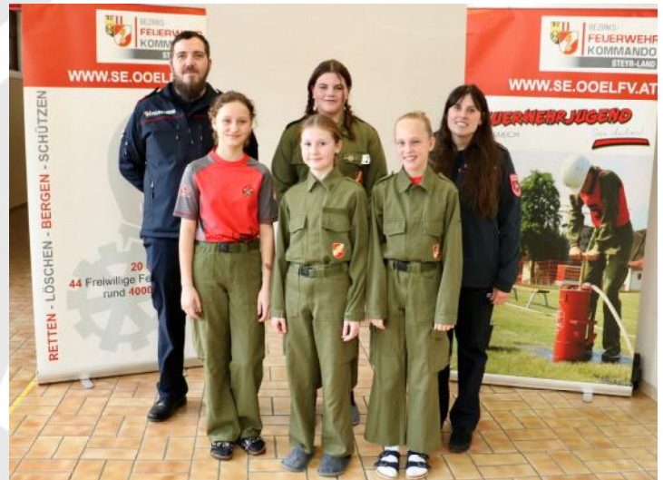
Die erfolgreichen Jugendmitglieder