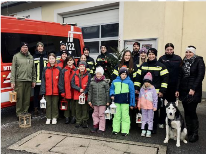
Gruppenfoto vor dem Feuerwehrhaus