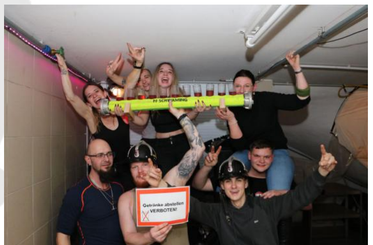
Tolle Stimmung bei der Krampusparty