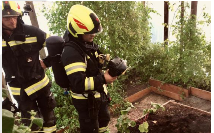
Schwellbrand am 29. August