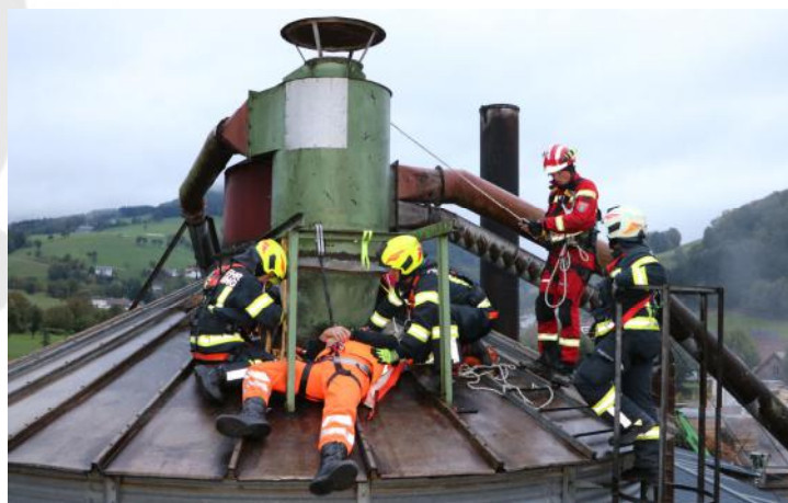
Unterstützung der Menschenrettung durch Höhenretter