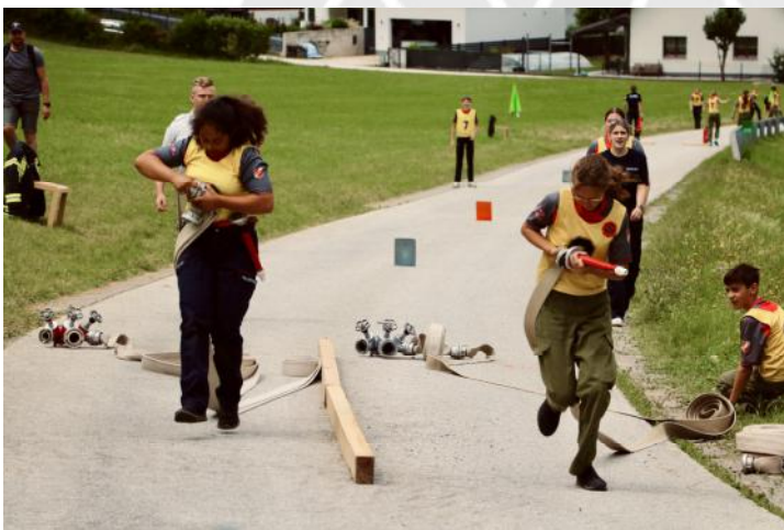
Perfektes Timing beim Staffellauf