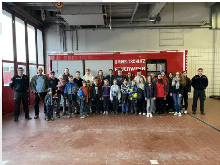
Gruppenbild in der Feuerwache

Ein großer Dank gilt der FF Wels für die Möglichkeit zur Besichtigung, sowie den Organisatoren dieses tollen Ausfluges.