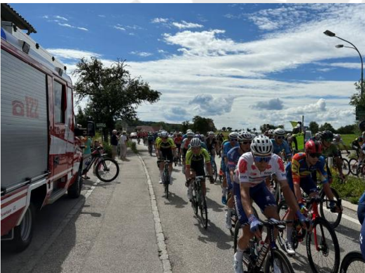
Die erste Verfolgergruppe bei der Durchfahrt in Christkindl

Mit rund einer Stunde Verspätung raste das gesamte Teilnehmerfeld mit einem beeindruckenden Tempo an unseren Einsatzkräften vorbei.