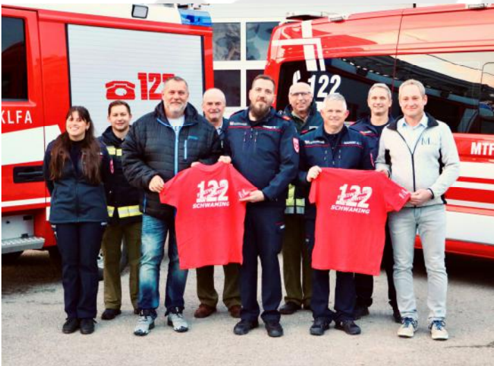
Übergabe der neuen T-Shirts