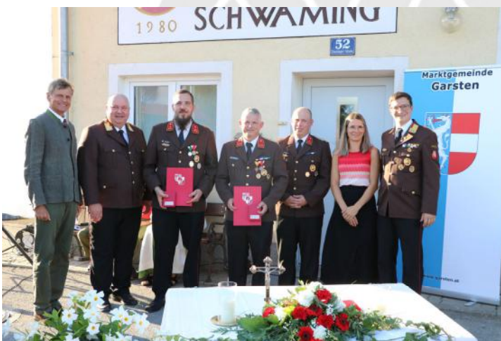
Auszeichnung des Führungsduos