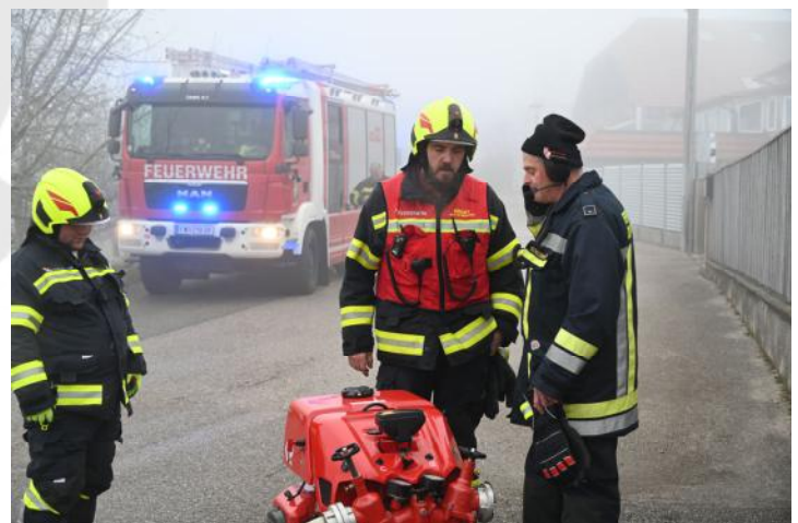
Besprechung bei der Wasserentnahmestelle

Insgesamt standen 12 Feuerwehren sowie die Polizei, das Rote Kreuz und das Kriseninterventionsteam im Einsatz.