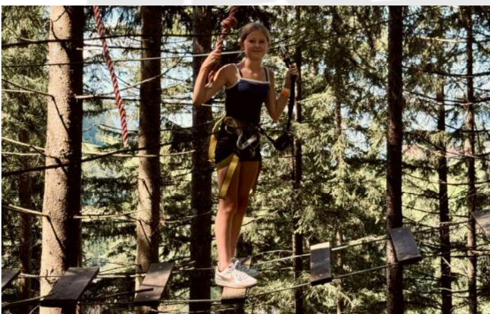
Mutig in den Höhen