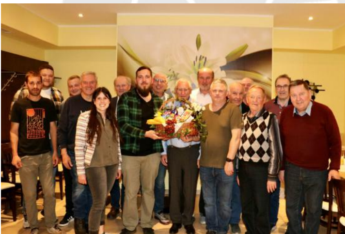
Übergabe des Geschnkskorbes