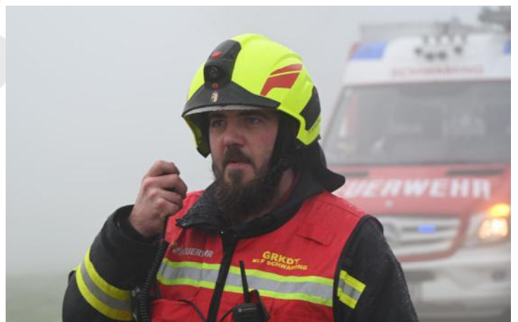
Brand Nebengebäude am 02. Dezember