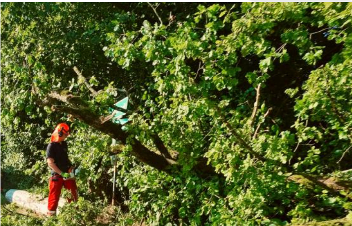
Umgestürzter Baum auf PKW am 14. August