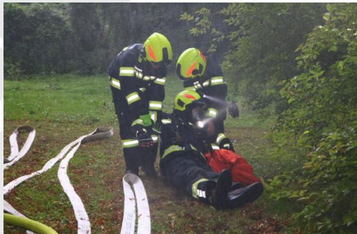
Beübung des Atemschutznotfalls

Beide Übungen zeigten die hohe Einsatzbereitschaft, den Wissensstand und die erfolgreiche Zusammenarbeit mit den Nachbarswehren.