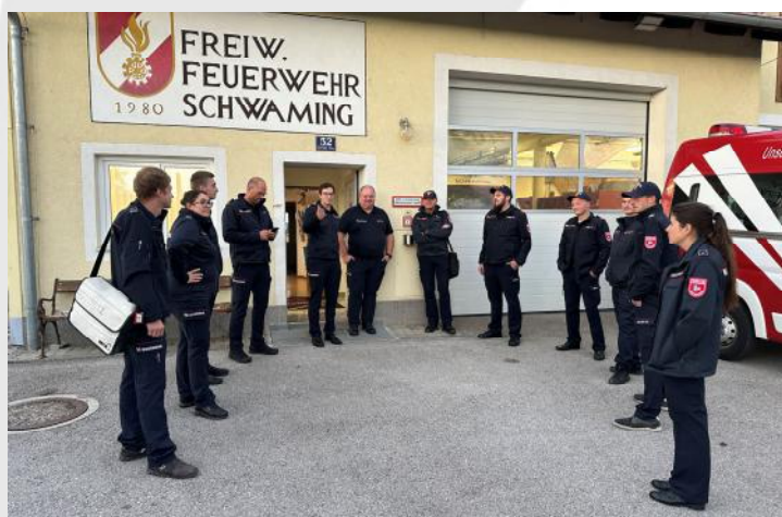
Abschlussgespräch vor dem Feuerwehrhaus

Die erfolgreiche Visitation bestätigt die hohe Qualität der Arbeit in unserer Feuerwehr und gibt uns wertvolle Impulse für die zukünftige Optimierung unserer Abläufe.