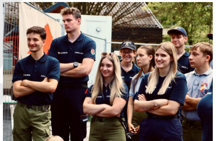
Gespannte Jugendbetreuer bei der Schlussveranstaltung