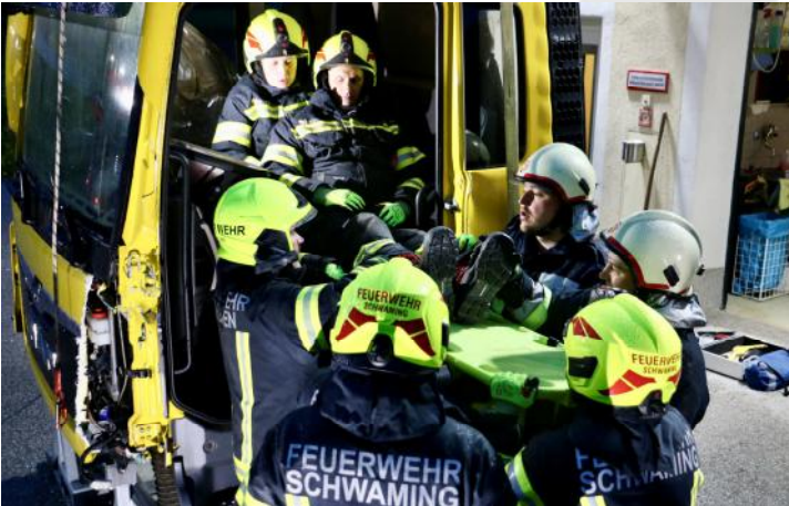
Menschenrettung aus LKW

Dabei wurde eine beeindruckende Summe von insgesamt 2.050 Ausbildungsstunden geleistet.