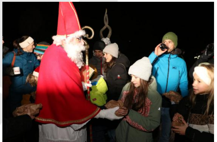
Nikolaus beim Verteilen der Geschenke

Zum Abschluss des Abends wurde bei der Krampusparty in ausgelassener Stimmung bis in die frühen Morgenstunden gefeiert.