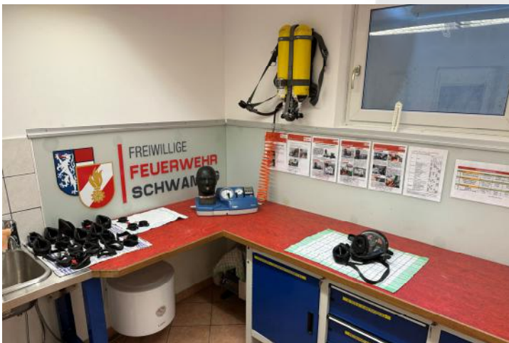
Neue Rückwand in der AS-Werkstatt

Dank dieser Modernisierung können wir die Wartung und Pflege unserer Atemschutzgeräte nun noch effizienter durchführen - ein wichtiger Schritt für die Sicherheit unserer Kameraden im Einsatz.