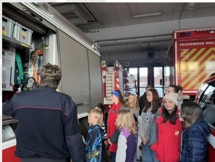
Gerätevorstellung in den Fahrzeugen