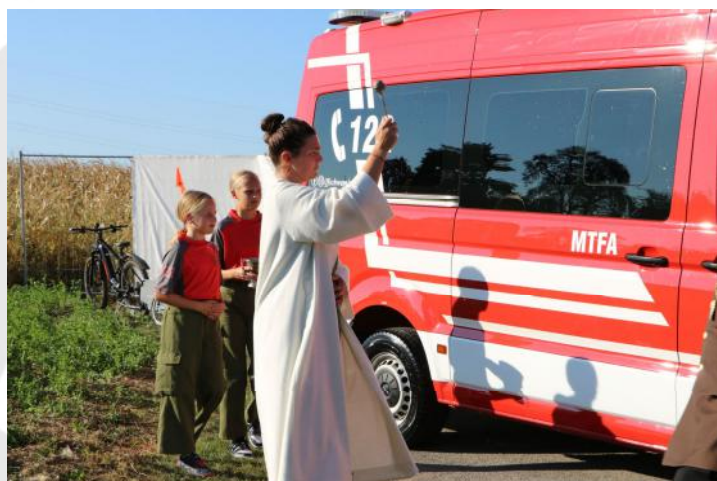
Segnung des neuen MTFs

ses neue Einsatzfahrzeug wird künftig eine wichtige Rolle bei unseren vielfältigen Aufgaben spielen.