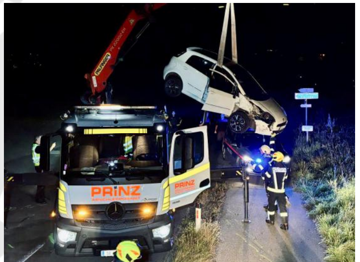
Bergung des verunfallten PKWs

Nach etwas über einer Stunde konnten die 16 Einsatzkräfte den Einsatz beenden und in das Feuerwehrhaus einrücken.