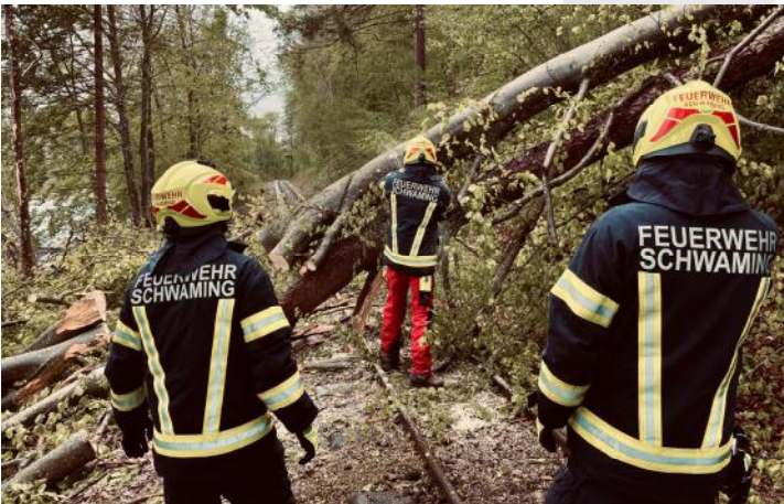
Freimachen von Verkehrswegen am 25. April

Einsätze wurden von 206 Einsatzkräften über 368 ehrenamtliche Einsatzstunden geleistet. Die Zahlen verdeutlichen die hohe Einsatzbereitschaft und Kompetenz unserer Mitglieder, die durch regelmäßige Aus- und Weiterbildungen ein hohes Niveau an Sicherheit gewährleisten können.