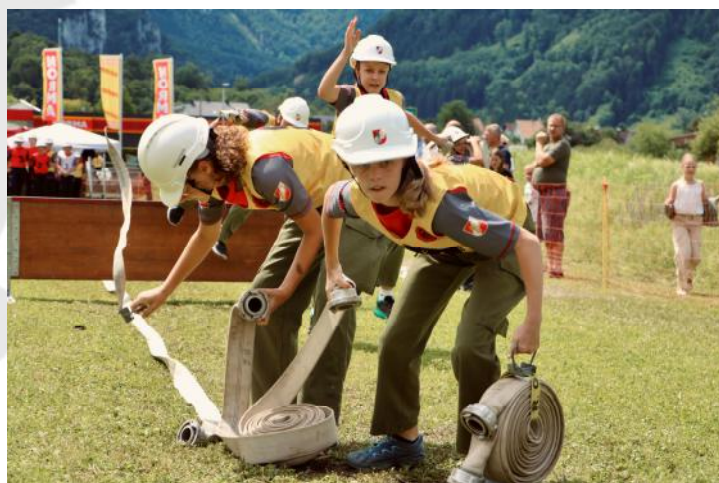
Fokussierte Blicke auf der Hindernisbahn