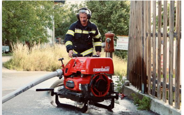
Wasserentnahme von einem Hydranten