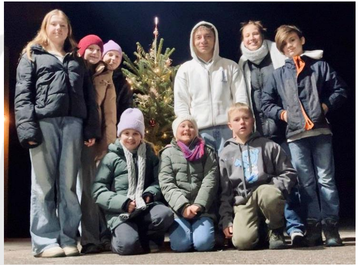
Weihnachtsbaum durch Jugendgruppe aufgeputzt

Ein herzliches Dankeschön gilt der Familie Doppelbauer für die Spende des schönen Baumes.