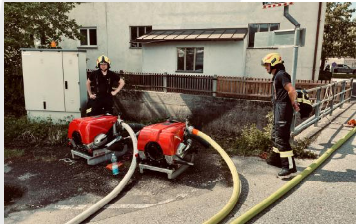
Brand Industrie am 29. April