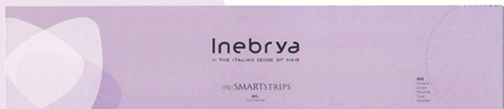
SMARTSTRIPS BIG (50x10cm)