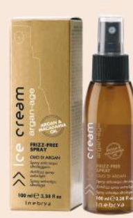
ARGAN-AGE FRIZZ-FREE SPRAY 100ml