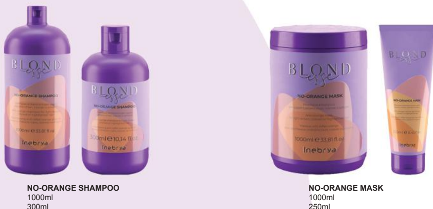
NO-ORANGE SHAMPOO 1000ml 300ml

Upotreba: nakon pranja kose šamponom No-Orange, nosite rukavice za jednokratnu upotrebu, nanesite na mokru kosu na dužinu i krajeve, ostavite da deluje 3 do 5 minuta i temeljno isperite.