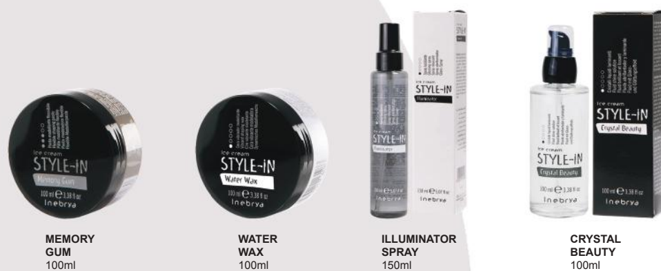
MEMORY GUM 100ml

Kapi za visok sjaj kose. Zatvaraju kutikulu i oplemenjuju površinu kose. Čine kosu svilenkastom i sjajnom. Nemasna formula. Posebno se preporučuje hemijski tretiranoj kosi. Upotreba: Može se koristiti na suvoj i vlažnoj kosi. Kod kovrdžanja ili ispravljanja. Sa mirisom Dunje.