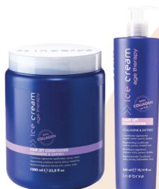
AGE THERAPY HAIR LIFT CONDITIONER 1000ml 300ml