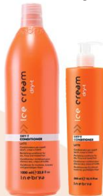
DRY-T CONDITIONER 1000ml 300ml