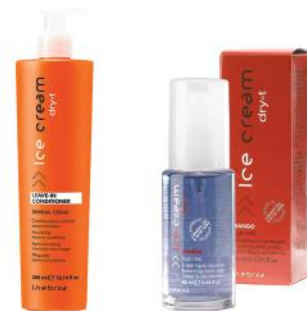
LEAVE IN CONDITIONER 300ml