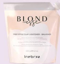
FREE STYLE CLAY LIGHTNER - BALAYAGE 400gr