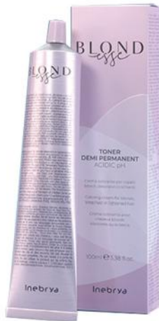
DEMI PERMANENT TONERS 100ml

NE prekriva sedu kosu. Mešanje sa razvijanjem 1:2 Vreme delovanja od 3 do 15 min. Preporučeni razvijajući: 3,5/7/10 VOL