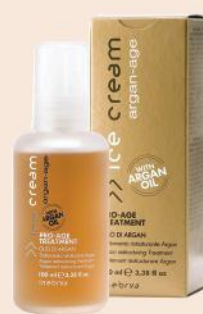
ARGAN-AGE TREATMENT 100ml