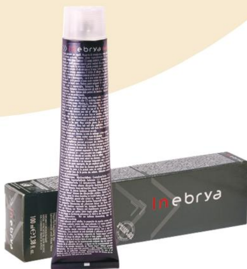
INEBRYA COLOR 104 Nijansi 100ml