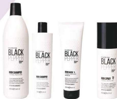
IRON SHAMPOO 1000ml 300ml