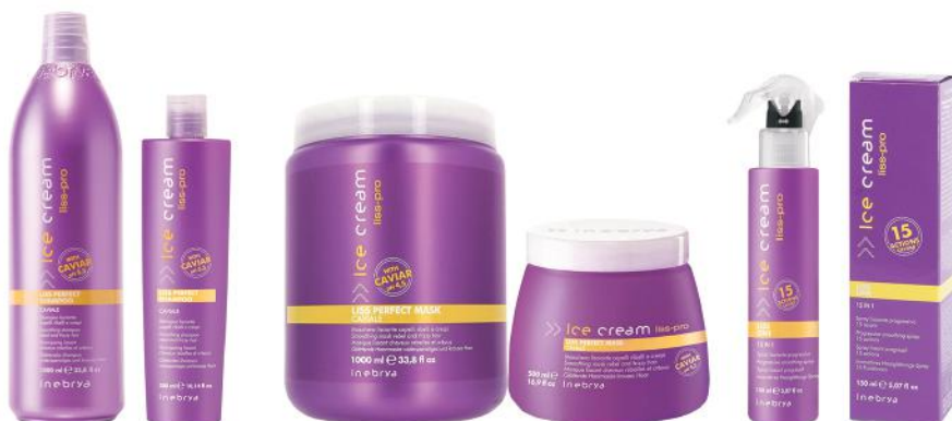
LISS PERFECT SHAMPOO 1000ml 300ml