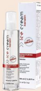
RESTRUCTURING SERUM 100ml

Upotreba: Naneti manju količinu na vlažnu ili suhu kosu. Ne ispirati.