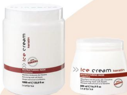
RESTRUCTURING MASK 1000ml 500ml