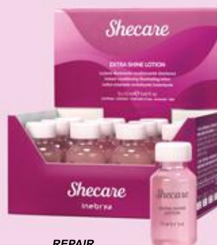
REPAIR EXTRA SHINE LOTION 12ml x 12ml