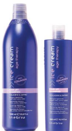
AGE THERAPY HAIR LIFT SHAMPOO 1000ml 300ml

Upotreba: Nanesite malu količinu rukama na vlažnu kosu. Ne ispirati. Stilizovati po želji. Može se koristiti i na suvoj kosi.