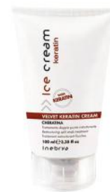
VELVET KERATIN CREAM 100ml