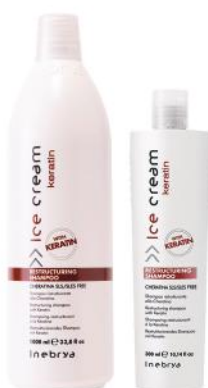
RESTRUCTURING SHAMPOO 1000ml 300ml

Upotreba: Naprskajte sprej na suhu kosu. Ostavite da deluje 1 minut i očešljajte. Pre upotrebe promuckati.