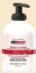
ROSSO CILIEGIA 300ml