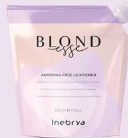
AMMONIA FREE LIGHTNER 500gr