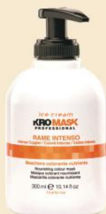
RAME INTENSO 300ml