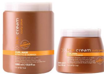
CURL MASK 1000ml 500ml