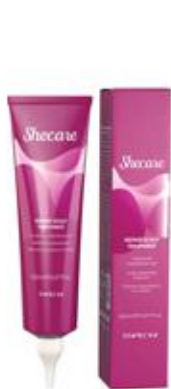
REPAIR SCALP TREATMENT 150ml

UPOTREBA: Ravnomerno nanesite na vlažnu kosu. Počešljajte i nastavite sa stilizovanjem. NE ISPIRATI!!