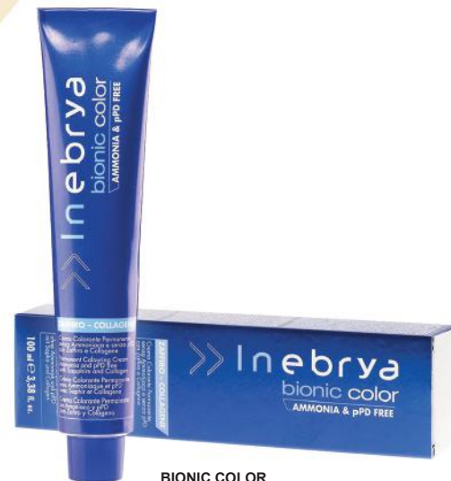
BIONIC COLOR 74 nijanse 100ml