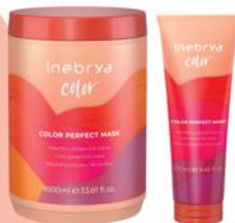
COLOR PERFECT MASK 1000ml 250ml