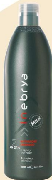
INEBRYA HIDROGEN PEROKSID 1000ml