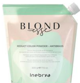
REDUCT COLOR POWDER - ANTIBRASS 500gr