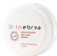
COLOR CLEAN STAIN REMOVER 150ml