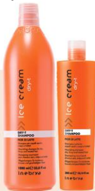
DRY-T SHAMPOO 1000ml 300ml

Tečni kristali sa uljem Lana. Idealne za suhu i bojenju kosu. Hrani i hidrira. Ostavlja kosu punom sjaja i olakšava njeno oblikovanje. Štiti i čuva kosu od mršenja. Upotreba: Naneti na suhu kosu za sjaj i sprečavanje cvetanja krajeva ili na vlnastu kosu da bi izbegli mršenje krajeva tokom feniranja.