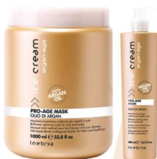
ARGAN-AGE MASK 1000ml 300ml