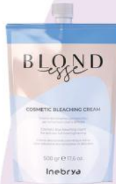
COSMETIC BLEACHING CREAM 500gr