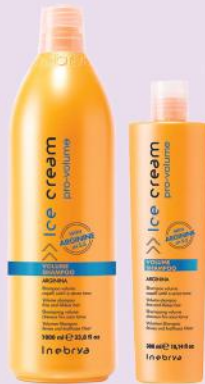
VOLUME SHAMPOO 1000ml 300ml