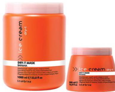
DRY-T MASK 1000ml 500ml