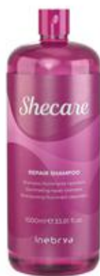
REPAIR SHAMPOO 1000ml 300ml