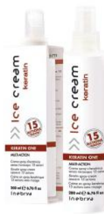
KERATIN ONE 250ml