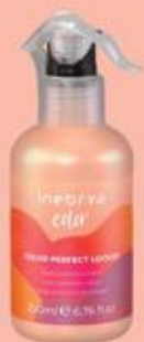
COLOR PERFECT LOCKER 200ml

Čini kosu trenutno blistavom i sjajnom za oko, mekom i svilenkastom na dodir. Upozorenje: zapaljivo. Ne prskati na otvoreni plamen. UPOTREBA: Naprskajte po dužini suve kose da biste osvetlili završni sloj.