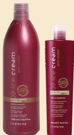
COLOR PERFECT SHAMPOO 1000ml

Savršen serum za bojenu kosu. Obogaćen zlatom, dijamantom i rubinom. Oblaže dlaku sa zaštitnom folijom protiv ispiranja boje koja štiti boju od gubitka intenziteta. Daje ekstremni sjaj kosi u dužem periodu čineći je odmah blistavom, mekanom i svilenkastom, bez mašćenja ili otežavanja. Savršeno smiruje neposlušnu kosu i sprečava ponovno mršenje krajeva. Upotreba: naneti nekoliko kapi na vlažnu ili suhu kosu Ne ispirati.