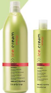
ENERGY SHAMPOO 1000ml 300ml