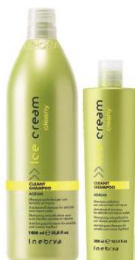
CLEANY SHAMPOO 1000ml 300ml