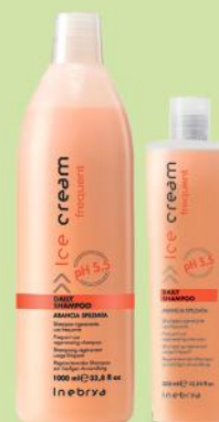
DAILY SHAMPOO 1000ml 300ml