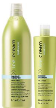
BALANCE SHAMPOO 1000ml 300ml

Instant SOS neispirajuća krema. U trenutku razmršava zamršenu kosu. Ostavlja kosu mekanom i sjajnom. Formulisan da ojača kosu. Pomaže u borbi protiv lomljenja i cvetanja krajeva. Upotreba: Nakon pranja na isfrotiranu kosu naneti na dužinu i krajeve. Ne ispirati. Osušiti kosu kao i obično.