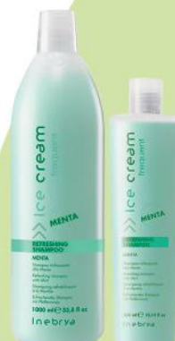
REFRESHING SHAMPOO 1000ml 300ml