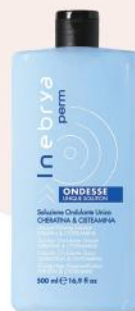
ONDESSE UNIQUE SOLUTION 500ml