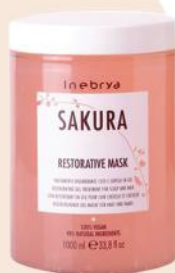
SAKURA RESTORATIVE MASK 1000ml 250ml