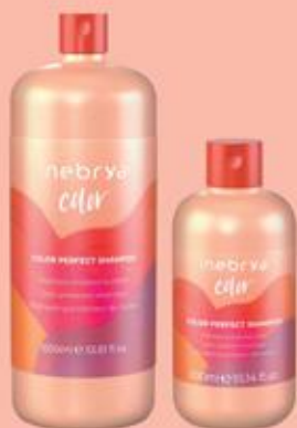
COLOR PERFECT SHAMPOO 1000ml 300ml