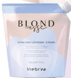
ULTRA FAST LIGHTNER - 9 TONES 500gr