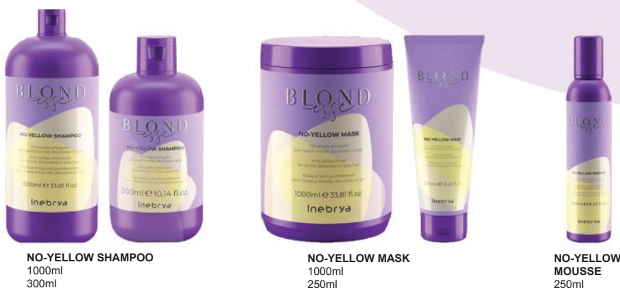
NO-YELLOW SHAMPOO 1000ml 300ml

Upotreba: Posle No Yellow šampona , ravnomerno nanesite na kosu osušenu peškirom po dužini i krajevima, ostavite da deluje 3 do 5 minuta i temeljito isperite. Pre upotrebe promuckati.