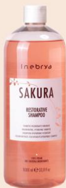
SAKURA RESTORATIVE SHAMPOO 1000ml 300ml

DODATAK: Faza 3. Ako osećate potrebu da kosu učinite lakšom za upravljanje, ponovo nanesite RESTORATIVNU MASKU na krajeve vlažne kose. Počešljajte, ostavite da deluje 3 minuta i isperite.