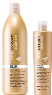
ARGAN-AGE SHAMPOO 1000ml 300ml

Upotreba: Nanesite sprej na vlažnu kosu pre oblikovanja ili na suhu za maksimalnu hidrataciju i sjaj. Ne ispirati.