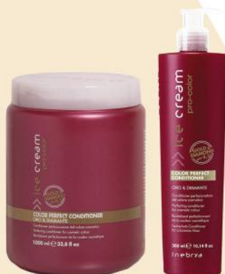
COLOR PERFECT CONDITIONER 1000ml 300ml