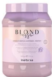
MIRACLE GENTLE LIGHTNER PROTECT 500gr

Upotreba: Nosite zaštitne rukavice. Stavite potrebnu količinu (od 20 do 30 g) dodajte željeni Inebrya razvijajući (odnos mešanja 1: 2) u nemetalnoj posudi. Promešajte mutilicom ili četkicom da biste dobili kremastu i ujednačenu teksturu. Vreme delovanja max 45min.