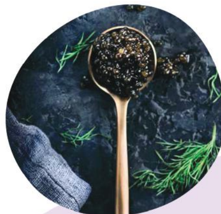
LISS ONE 150ml