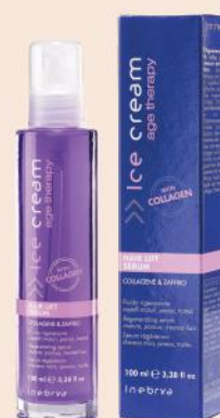
AGE THERAPY HAIR LIFT SERUM 100ml