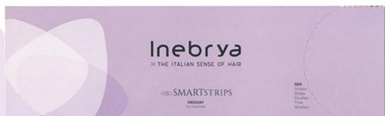
SMARTSTRIPS MEDIUM (35x10cm)