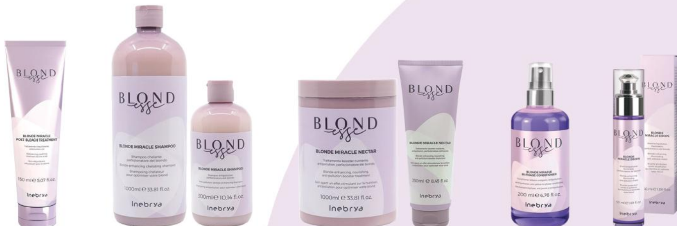
BLONDE MIRACLE POST-BLEACH TREATMENT 150ml

Štiti kosu od toplote, olakšava feniranje. Nanošenje nakon oblikovanja: Daje svilenkastost i sjaj. Zatvara rascvetale krajeve.