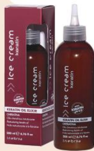
KERATIN OIL ELIXIR 200ml