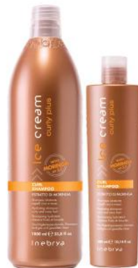
CURL SHAMPOO 1000ml 300ml