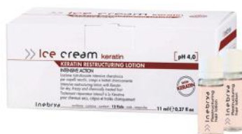
KERATIN RESTRUCTURING LOTION 12 x 11ml