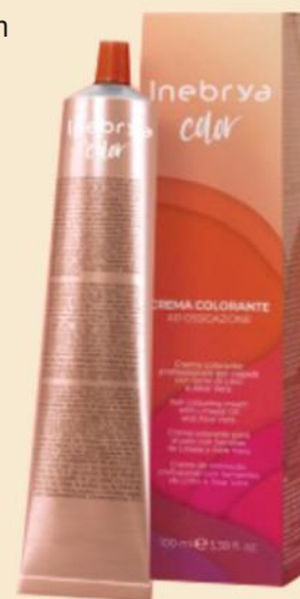
INEBRYA COLOR 9 Nijansi 100ml