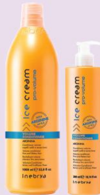
VOLUME CONDITIONER 1000ml 300ml