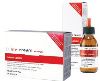
ENERGY LOTION 12 x 10ml 125ml