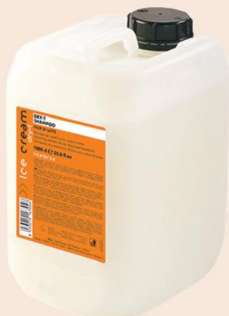
DRY-T SHAMPOO 10l