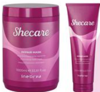
REPAIR MASK 1000ml 250ml