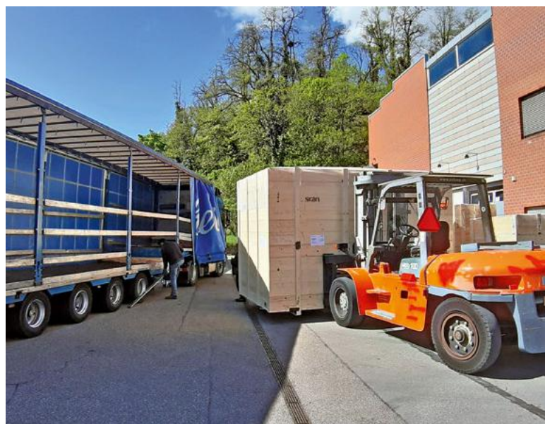
Z výrobního závodu společnosti SKAN AG v Allschwilu nedaleko Basileje jsme vyzvedli dobře zabalené plnicí zařízení vakcín a charterovými lety je přepravili do USA.