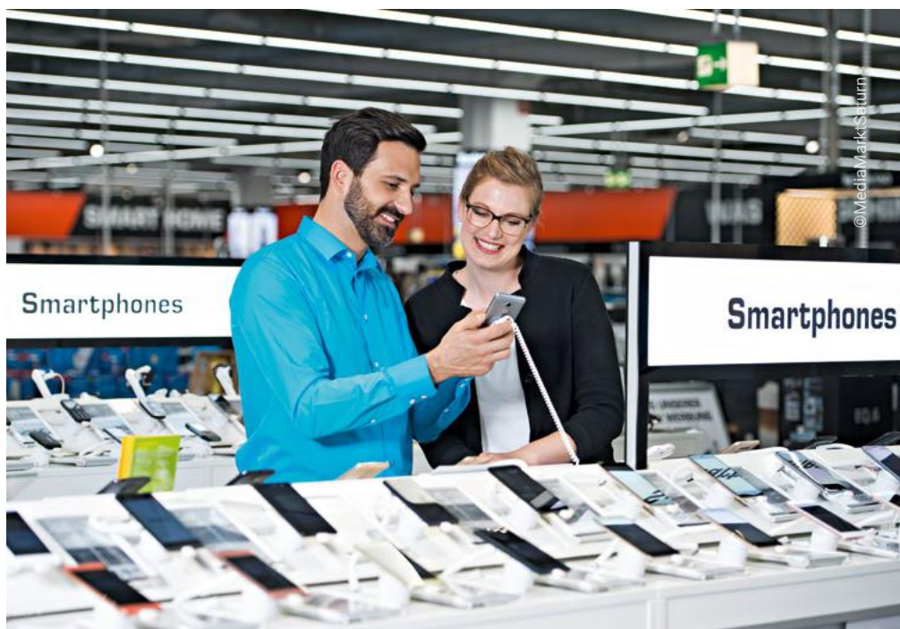
V budoucnu budou všechny německé prodejny MediaMarkt a Saturn dostávat zboží z nového centrálního skladu.

Naše činnosti zahrnují kompletní skladovou logistiku v rámci dodavatelského řetězce: Přijímání zboží od dodavatelů, jeho skladování a vychystávání a balení podle poptávky a oddělení pro včasné dodání do prodejen a online partnerům (např. Redcoon). Náš speciálně