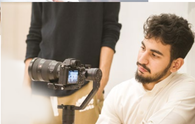
(تعمل الكلية تحت إشراف وزارة التعليم في المملكة العربية السعودية)