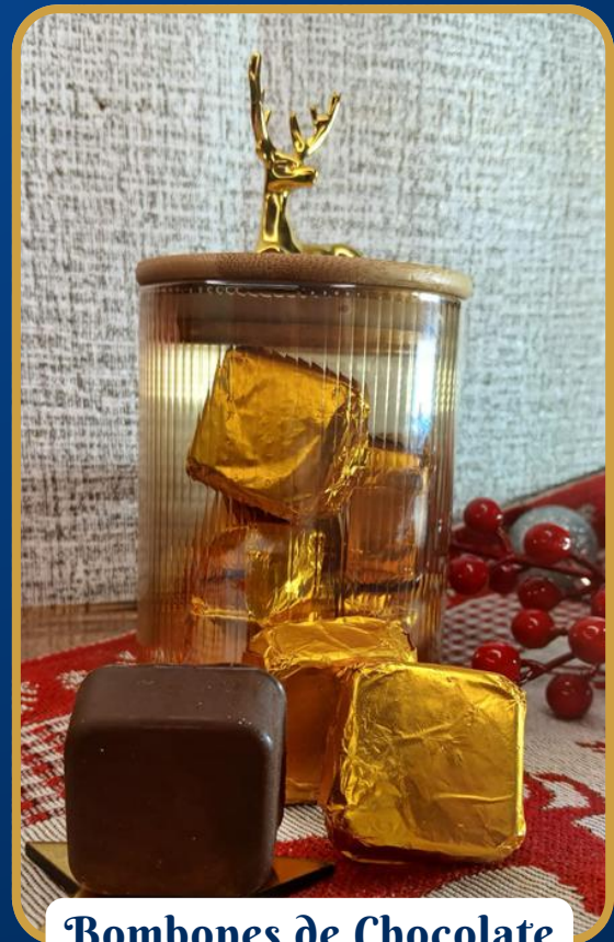
Bombones de Chocolate