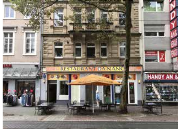
Kaiserstraße-Ost, Bildnachweis: HaRi

Der Kronenplatz soll neu belebt werden, in dem ein Aufenthaltsbereich geschaffen wurde. Teil des Sanierungskonzepts sind auch Maßnahmen zur Klimaanpassung, für die auch kleine Flächen Potenziale bieten.