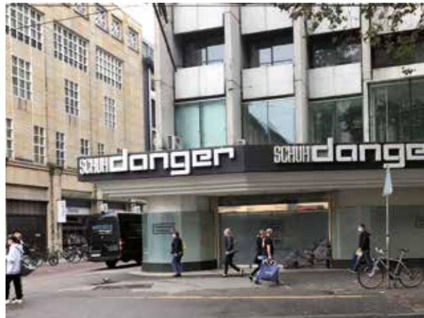
Leerstand Kaiserstraße-West

Aktuell: Aufgrund der COVID-19-Pandemie haben sich der strukturelle Wandel im Einzelhandel und die zunehmenden Leerstände auch in der Innenstadt beschleunigt. Online-Handel, Home-Office und der Rückgang von Geschäftsreisen haben zur Senkung der Besuchsfrequenz beigetragen. Gastronomie, Hotellerie und Kultureinrichtungen haben unter dem Lockdown extrem stark gelitten.