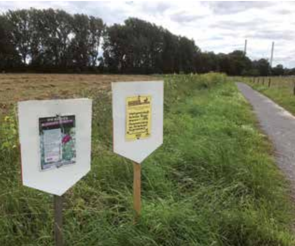
Blühstreifen „der AKB“ im Sommer.

Der AKB-Vorstand hat im Frühsommer beschlossen, sich auch im ökologischen Bereich bzw. für die Artenvielfalt zu engagieren.