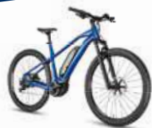
Zum Beispiel ein hochwertiges E-BIKE der Marke Scott ...

Mitmachen und Preise im Wert von 10.000 EUR gewinnen.