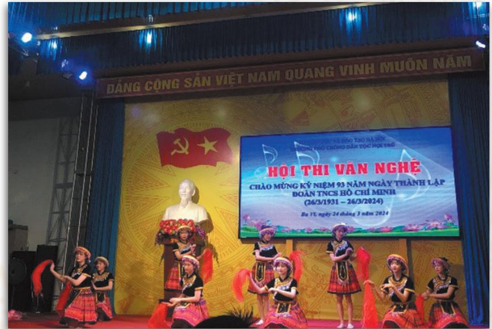
Hội thi văn nghệ chào mừng tháng thanh niên năm 2024