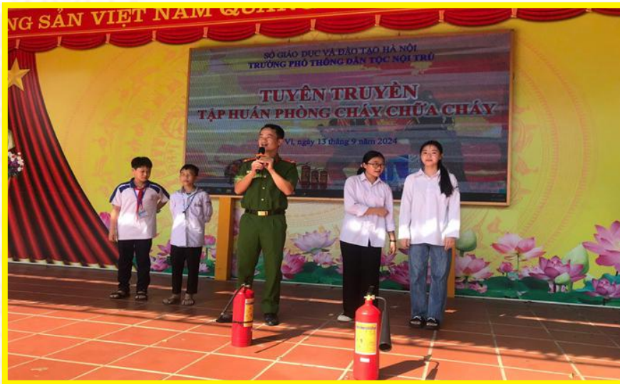
Tuyên truyền về PCCC