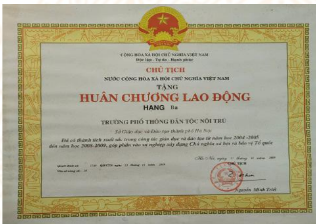
Huân Chương lao động Hạng 3 Giai đoạn 2004-2009