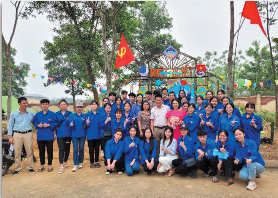
Hội trại tháng thanh niên năm 2023

Đoàn trường luôn “Đồng hành với thanh niên” bằng việc xây dựng và tổ chức nhiều chương trình, sân chơi trí tuệ, trải nghiệm thực tiễn nhằm nâng cao kiến thức, phát triển các kỹ năng thực hành xã hội, nâng cao đời sống văn hóa tinh thần: Phong trào “học sinh 3 tốt”, thi đấu thể thao, hội thi văn nghệ, thi học sinh thanh lịch, hội trại - ẩm thực... tạo không khí thi đua sôi nổi giữa các chi đoàn.