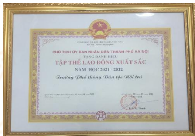
Tập thể LĐXS năm 2021-2022