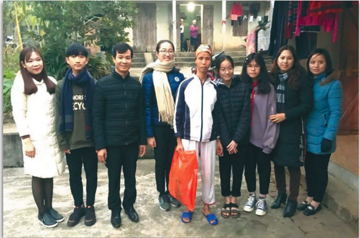
Tổ chức tặng quà cho các gia đình khó khăn, Tết nguyên đán năm 2020

Các hoạt động xung kích tình nguyện là nội dung quan trọng thường xuyên của Đoàn trường. Tổ chức các hoạt động tình nguyện tại chỗ cho đoàn viên thanh niên sẽ giúp học sinh có ý thức và trách nhiệm hơn qua việc đảm nhận thực hiện các công trình thanh niên, xây dựng nhà trường xanh - sạch - đẹp; chiến dịch tiếp sức mùa thi, Hoa phượng đỏ... Các em được giao nhiệm vụ lao động vệ sinh khuôn viên nhà trường, tự tay chăm sóc các bồn hoa cây cảnh. Công việc này được đoàn thanh niên kết hợp với các giáo viên chủ nhiệm giám sát và được đưa vào tính điểm thi đua giữa các chi đoàn.