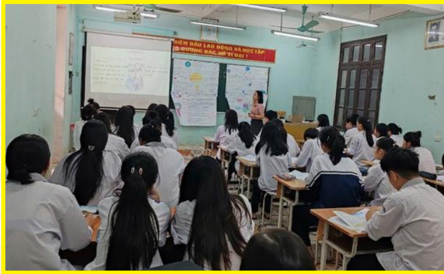
Giờ thao giảng môn Địa lí