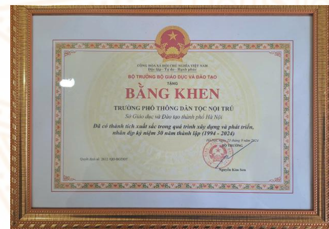
Bằng khen của Bộ giáo dục và Đào tạo năm 2024