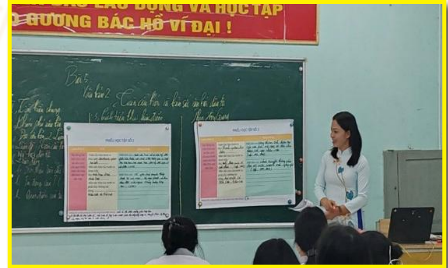
Giờ thao giảng môn Ngữ văn