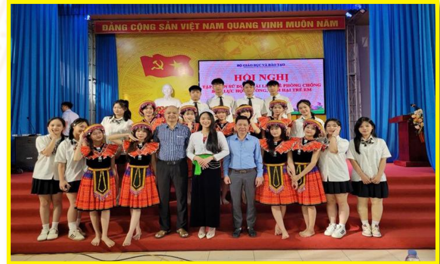
Tập huấn về phòng chống bạo lực học đường