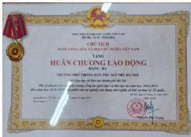
Huân Chương lao động Hạng 3 Giai đoạn 2014-2019