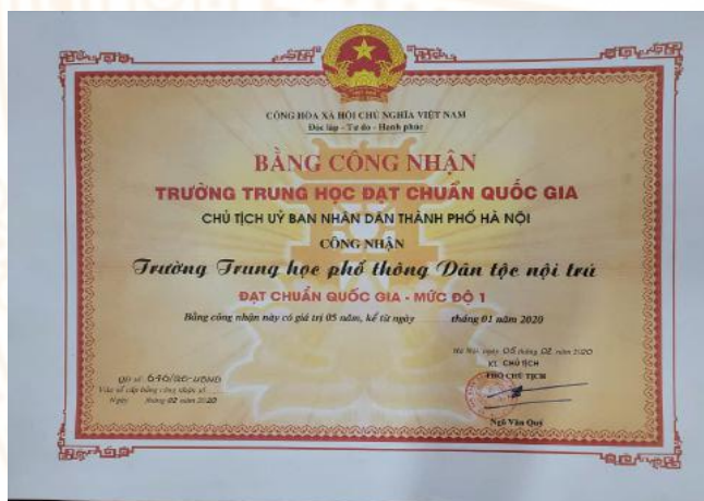
Bằng công nhận chuẩn quốc gia năm 2020