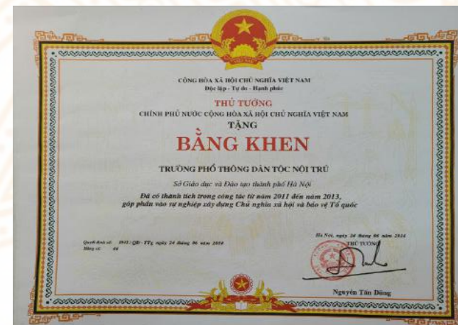
Bằng khen của Thủ Tướng Chính Phủ Giai đoạn 2011-2013