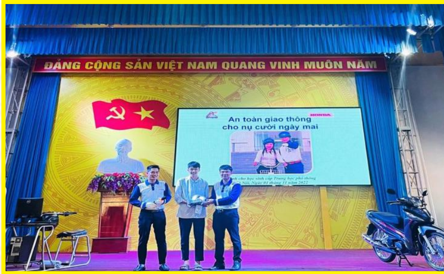
Tuyên truyền về an toàn giao thông