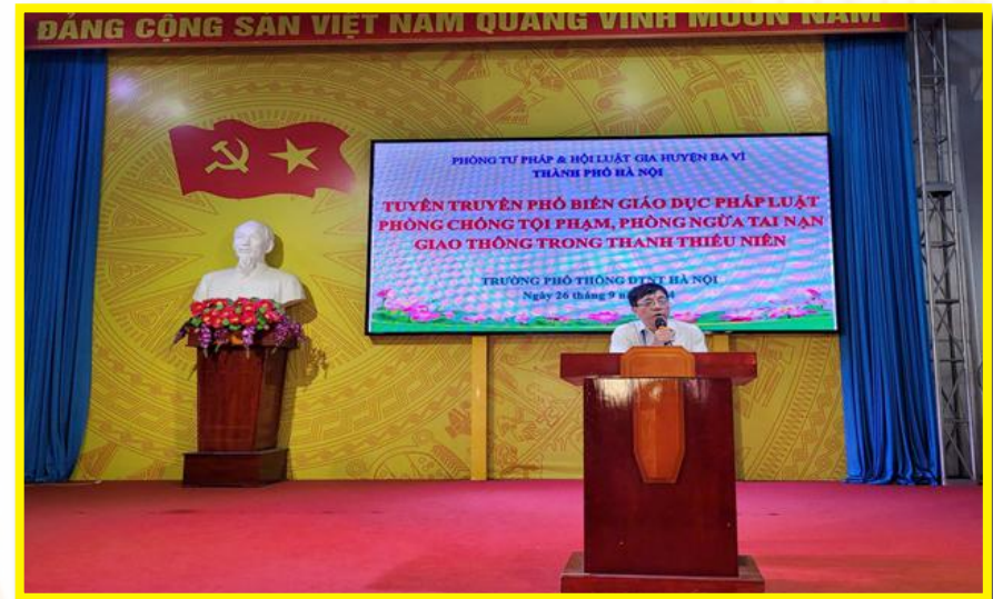
Tuyên truyền phổ biến giáo dục pháp luật