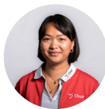
Bamboo Saluz Praktikantin