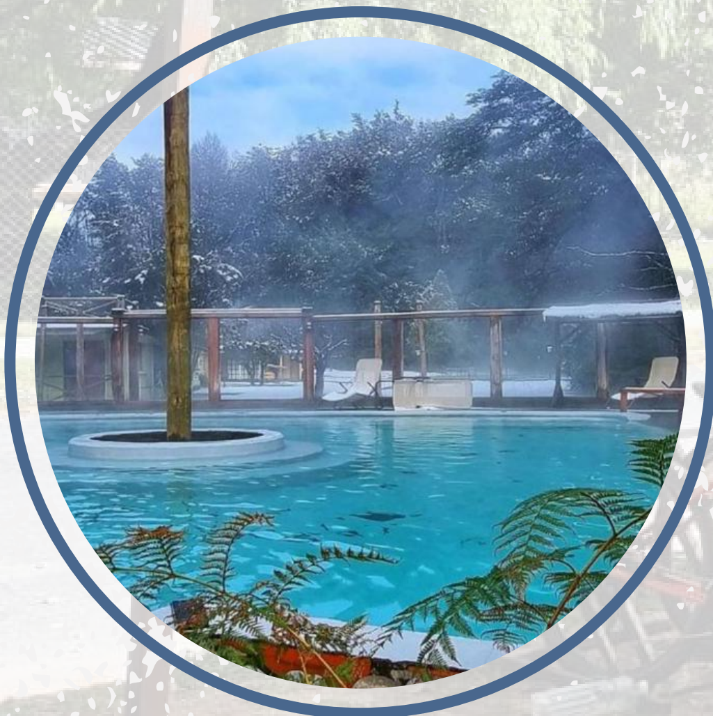
TERMAS DE MANZANAR