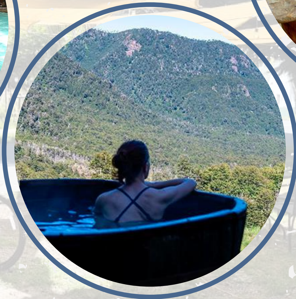
TERMAS CAÑON DEL BLANCO