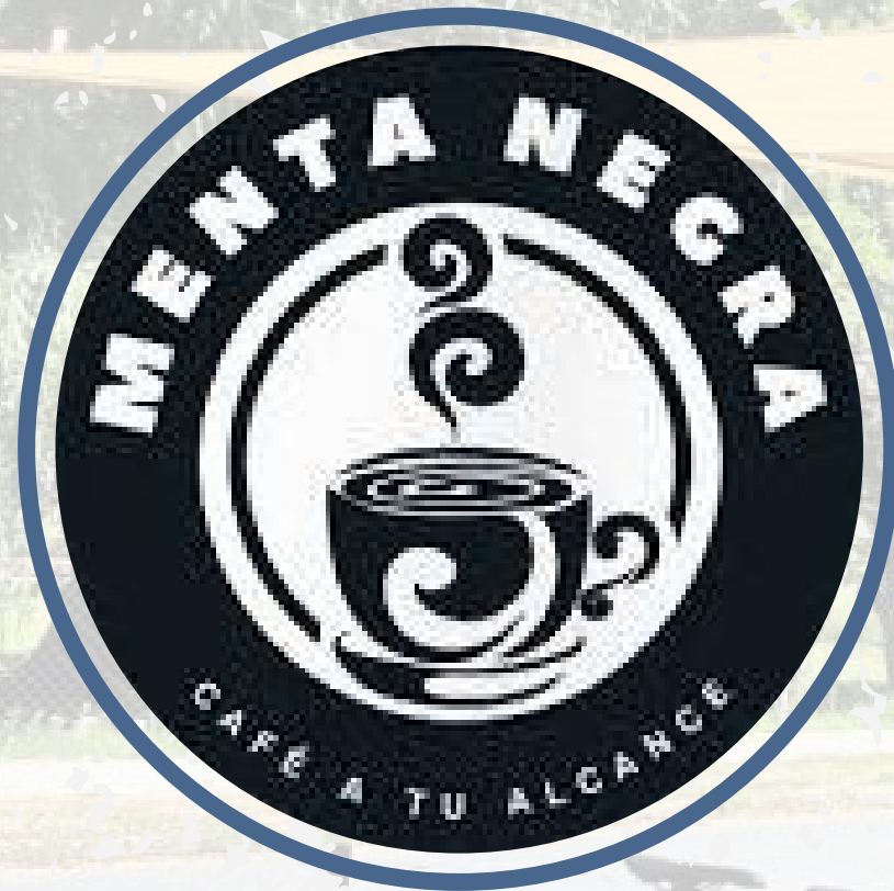
CAFETERIA MENTA NEGRA