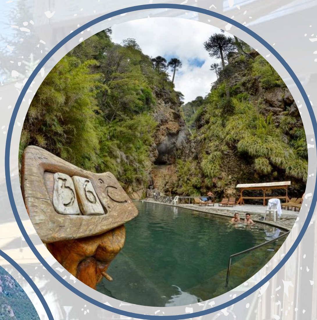
TERMAS DE MALLECO