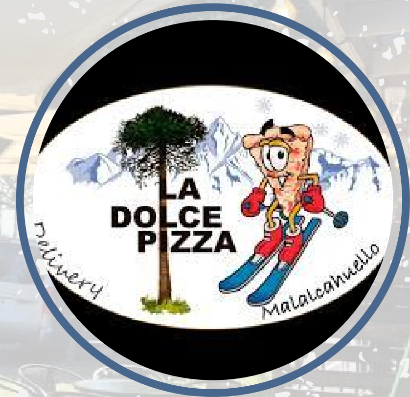
LA DOLCE PIZZA

Avenida Malalcahuello 408, Malalcahuello