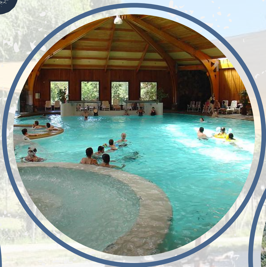
TERMAS DE MALALCAHUELLO