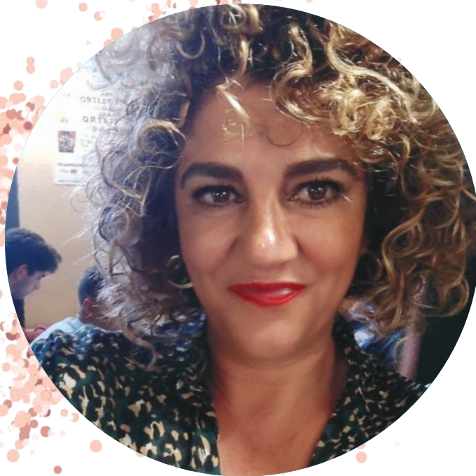
Elena Wedding Planner