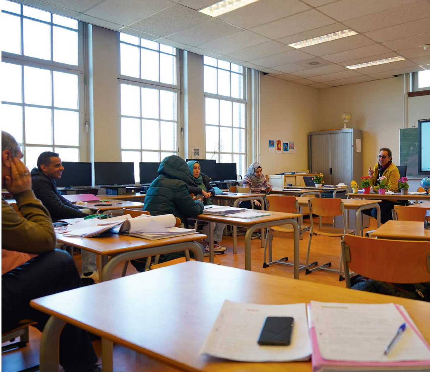
Nilofar Niekpor fotografeert de inburgering in Nederland, zoals deze klas in Nijmegen waar inburgeraars de Nederlandse taal hopen te leren.