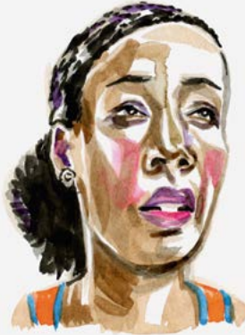
Sifan Hassan Atlete