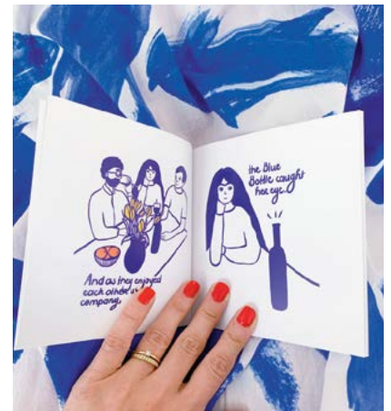
The Blue Bottle, een geïllustreerd verhaal van Emami, voor mediaplatform Lilith Mag

Met man en twee kinderen woont ze in Amsterdam met uitzicht op het IJ. Een huis vol kleur. Blauwe objecten keren terug in haar tekeningen voor feministisch mediaplatform Lilith Mag. Van roze gruwde ze lang. Dat veranderde na de geboorte van haar dochter. En zie, die kleur gaat prima samen met blauw. EW