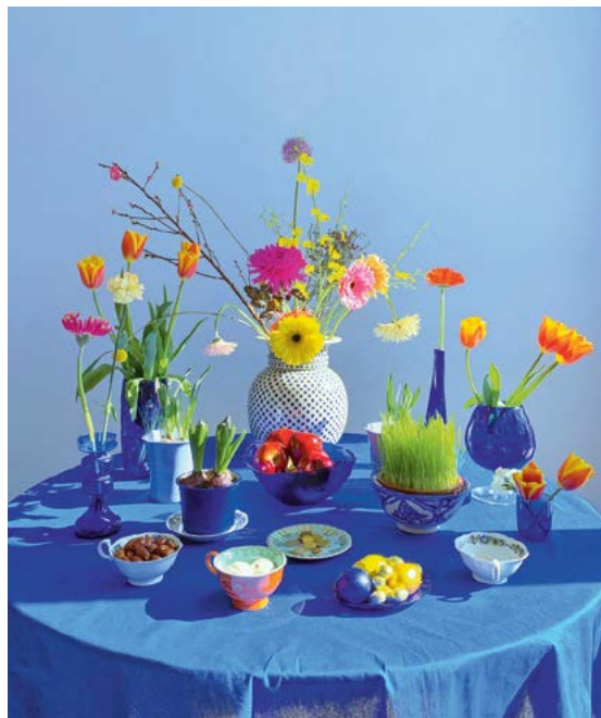
Haft-sin, arrangement van zeven symbolische items voor het Iraanse Nieuwjaar. De namen beginnen met de letter S