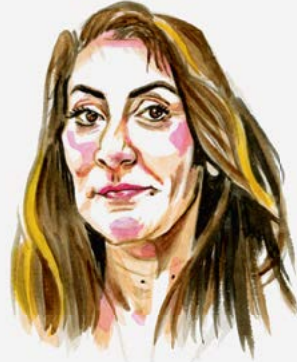
Dilan Yeşilgöz Minister