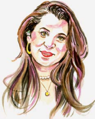
Karsu Dönmez Zangeres