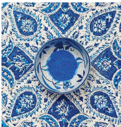
Lapis lazuli-poeder op een tafelkleed uit Isfahan, de twee na grootste stad van Iran