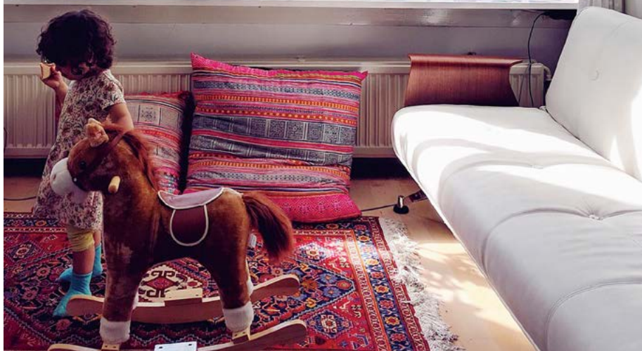
Collectie blauwe objecten in het oude huis van Sara Emami en haar gezin aan de Amsterdamse Bloemgracht. Haar liefde voor de kleur blauw ontstond in Delft, waar ze opgroeide en studeerde