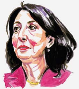
Khadija Arif Oud-Kamervoorzitter