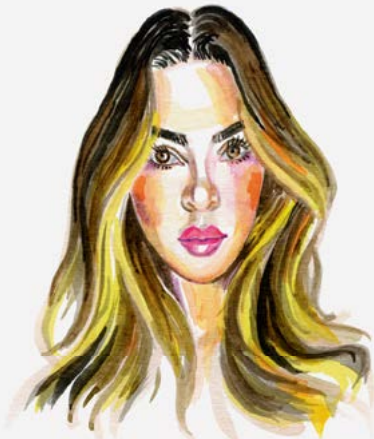
Negin Mirsalehi Influencer