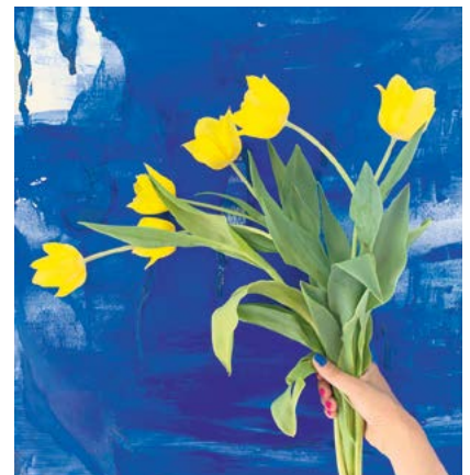
Gele tulpen, met als achtergrond een blauw schilderij door Sara Emami