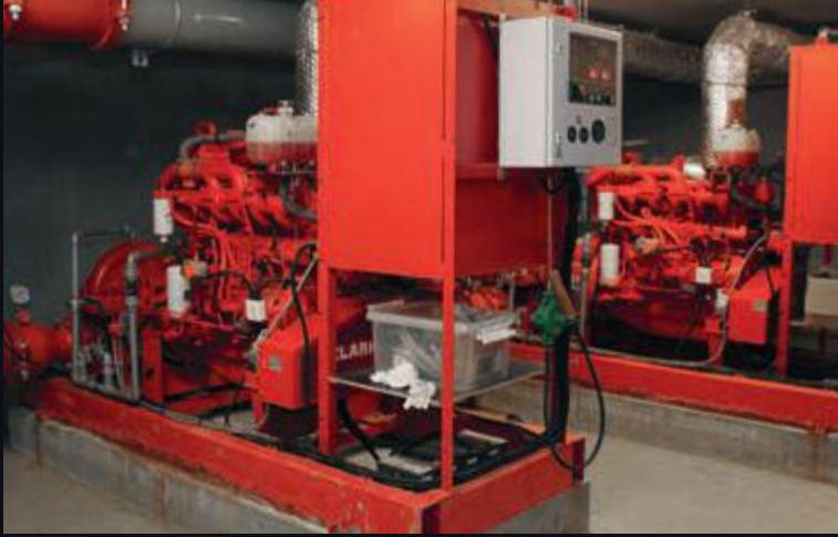
2 kæmpe 6-cylindrede turbodiesel motorer sørger for at levere det fornødne vandtryk til sprinkleranlægget i tilfælde af brand.