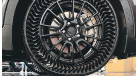
Michelin Uptis (Unique Puncture-proof Tire System) – en kombination af et aluminiumshjul og en fleksibel bærende konstruktion fremstillet af glasfiberforstærket plast (GFRP).

For at indlede rejsen mod fremtidens bæredygtige dæk allerede i dag satte Michelin fokus på genanvendelse af plastaffald i dæk på årets IAA-messe (7-12. september). Her samlede seks hold af Michelin-ansatte sammen med den velkendte Michelin-mand og de besøgende bl.a. plastflasker og andet plastaffald. Samtidig kunne Michelins såkaldte "REGENLab" trin for trin demonstrere, hvordan råmaterialer til nye dæk kan laves af f.eks. træ, PET og engangsplastaffald. På sin messestand viste Michelin også sit 100 pct. bæredygtige og 3D-printede, Michelin Vision Concept-dæk.