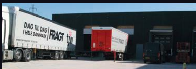
Eksterne transportører er i gang med flytningen af hjul fra Brøndby til Køge.