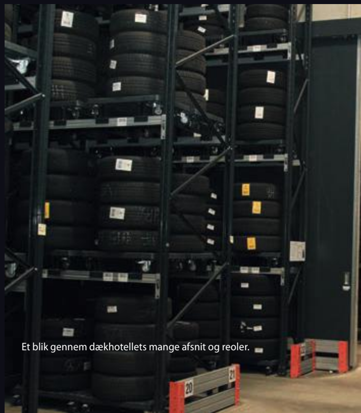
Et blik gennem dækhotellets mange afsnit og reoler.