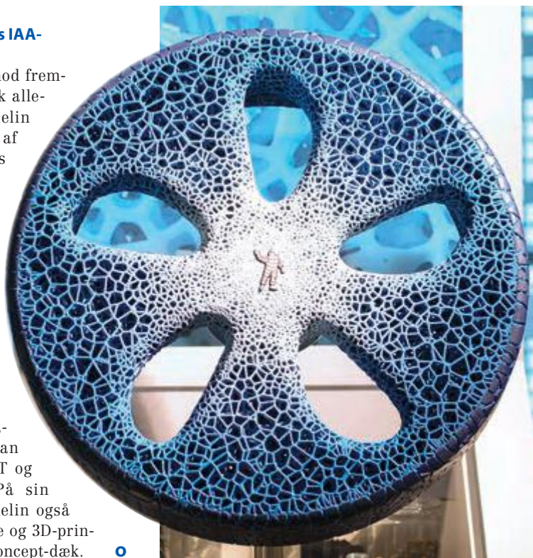
Michelin Vision Concept.