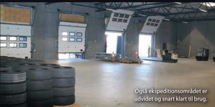
Også ekspeditionsområdet er udvidet og snart klart til brug.

Reoler til opbevaring og trolleys til transport af hjulsættene er af eget design, så alt er optimeret hos TyreTrust til bedst mulige håndte-