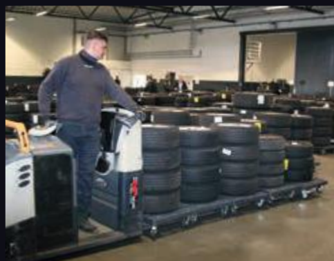
Gaffeltrucks med særligt lange gafler sørger for optimeret transport i hotellet.