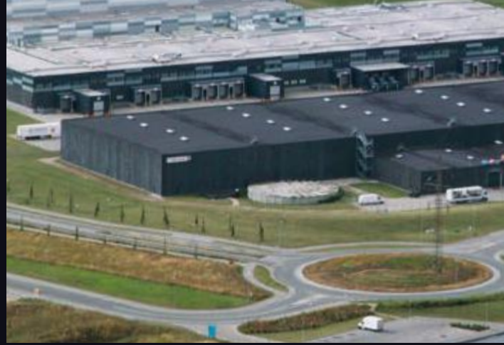
TyreTrust i Køge er ved at være færdig til fuldt brug.