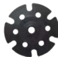
POWDER DISC art: D/70F