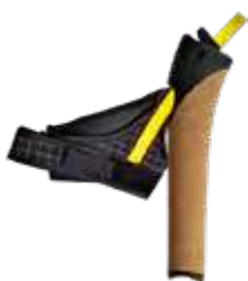
Model: NORDIC RACE art.: G/17