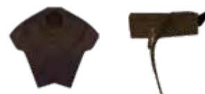
WING RACE art.: B/55