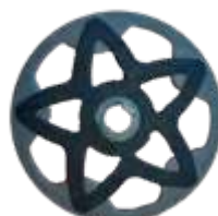
QBC POWDER art: D/70QBC