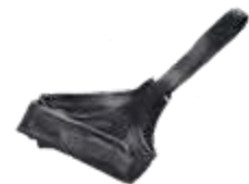
Model: ECS art.: P/42