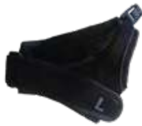
Model: RCS CLICK art.: P/40