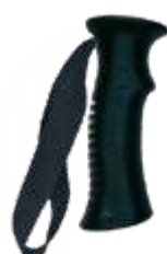
Model: RACE JR art.: G/12