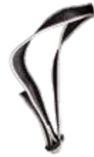
Model: 3D art.: P/32