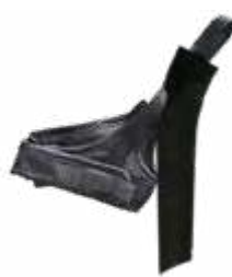
Model: NORDIC 2D art.: G/10