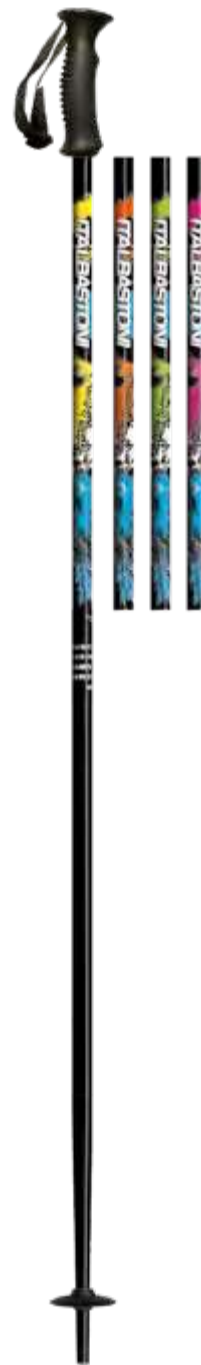
CLOUD JR art.1005W1617

materiale/material: AL F45 diametro/diameter: Ø16 mm misura/lengths: 70-105cm