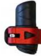
Model: QUICKLOCK PLUS art.: Q/54