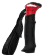
Model: ALIEN LITE art.: G/18