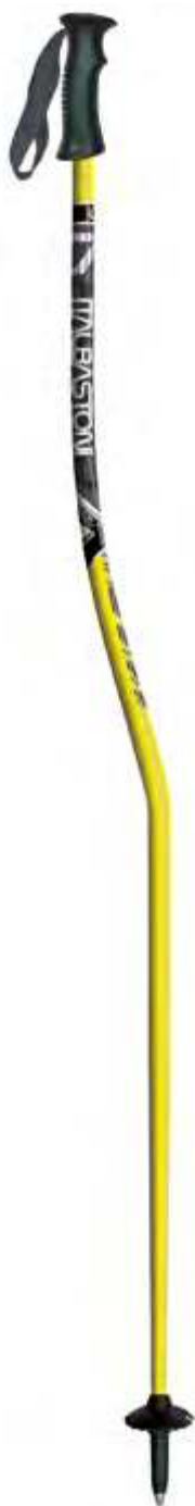
RACE JR art.05W1920

materiale/material: AL F56 diametro/diameter: Ø16 mm misura/lengths: 70-105cm