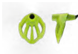
SKITOUR RACE art: B/57