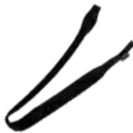
Model: BIATHLON art.: P/43