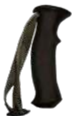
Model: ALPINE SR art.: G/05