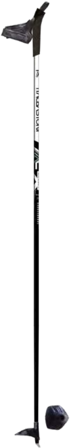
XC SPORT art. 03W2021

materiale/material: CARBON 10 diametro/diameter: Ø16mm misura/lengths: 120-165cm [5cm steps]