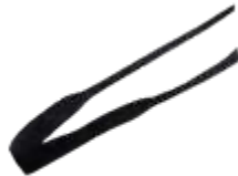
Model: NORDIC art.: P/44