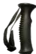
Model: ALPINE JR art.: G/05