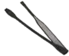
Model: ASS COMFORT art.: P/33