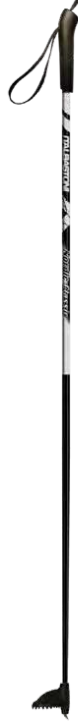
XC NORDIC art.0743W1112

materiale/material: AL F45 diametro/diameter: Ø16mm misura/lengths: 120-160cm [5cm steps]