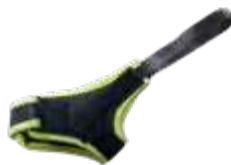
Model: RCS art.: P/41