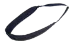
Model: COMFORT art.: P/45