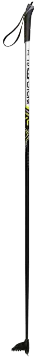
XC SPEED art.0742W1112

materiale/material: AL F56 diametro/diameter: Ø16mm misura/lengths: 130-170cm [5cm steps]