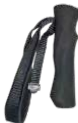
Model: FOAM 100 art.: G/20