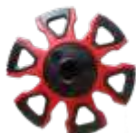
SKITOUR DISK art: B/56