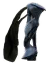
Model: RAPTOR art.: G/06