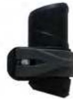
Model: QUICKLOCK art.: Q/53