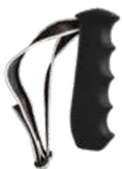
Model: ERGO art.: G/04