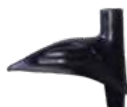
TOUR art: B/54