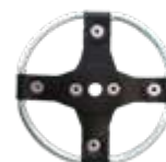
BC DISK art: B/60