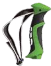
Model: RACE 2D PLUS art.: G/16B