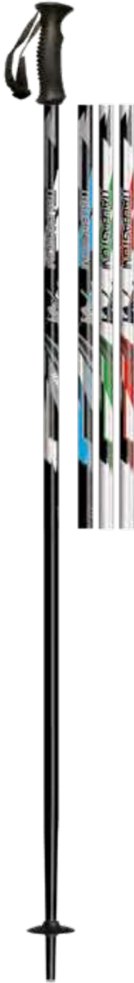
KID ROCK art.1010W1314

materiale/material: AL F45 diametro/diameter: Ø14 mm misura/lengths: 70-105cm