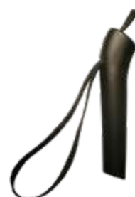
Model: NORDIC BASIC art.: G/9