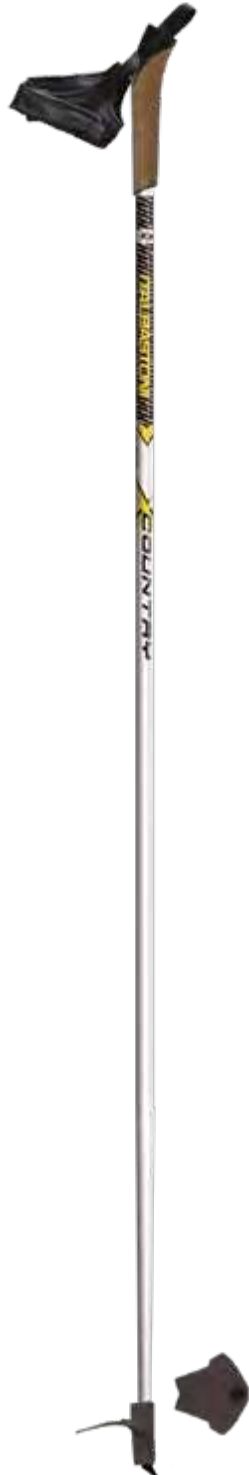
XC RACING art.0741W1112

materiale/material: CARBON 10 diametro/diameter: Ø16mm misura/lengths: 120-165cm [5cm steps]