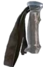
Model: TREK TRASP art.: N/17