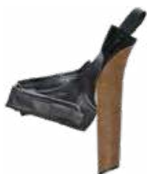
Model: NORDIC 2D CORK art.: G/10-C