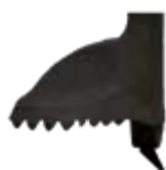
CROSS art: B/53