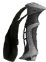
Model: RACE 2D art.: G/16