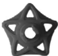
QBC SNOW art: D/48QBC