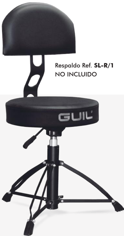
Respaldo Ref. SL-R/1 NO INCLUIDO

El sillín reforzado de batería SL-16, está preparado para que se le incorpore nuestro respaldo ergonómico ref. SL-R/1. El respaldo para sillín es regulable en inclinación y profundidad para poder adaptarse a la postura única de cada usuario. El conjunto del sillín con el respaldo son la combinación perfecta para cualquier músico.