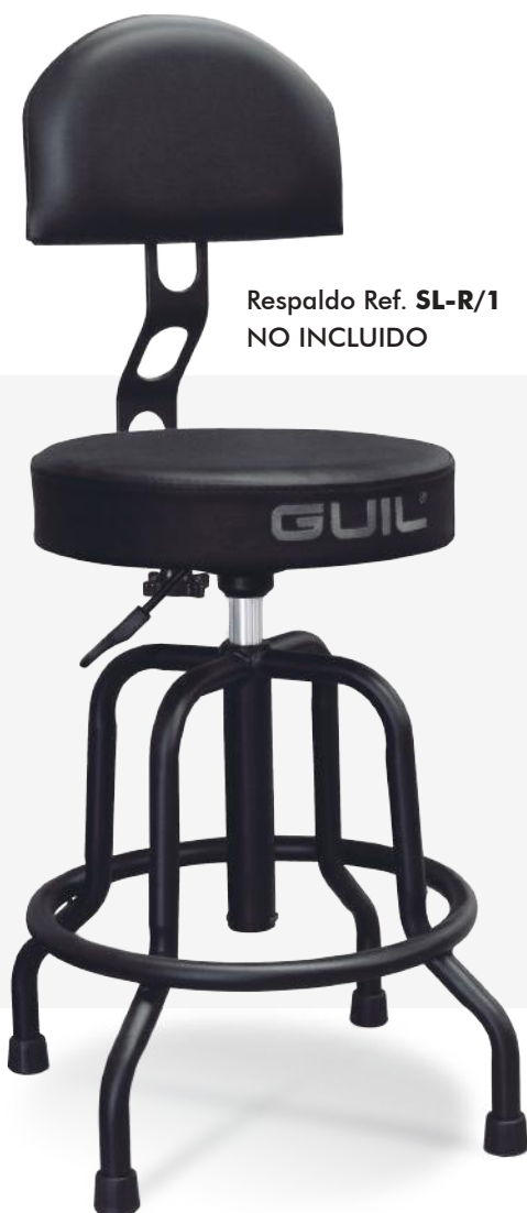
Respaldo Ref. SL-R/1 NO INCLUIDO

Está provisto de un reposapiés circular de 360° que permite una cómoda postura tanto sentado como simplemente apoyado sobre el asiento.