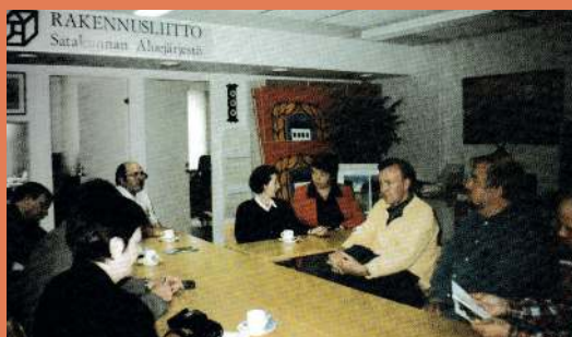
Ar Igaunijas un Lietuvas arodbiedrībām.