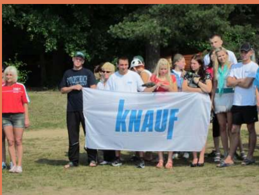
SIA „Knauf” AO „Saurieši” komanda LBAS sporta spēlēs Kuldīgas apkārtnē.