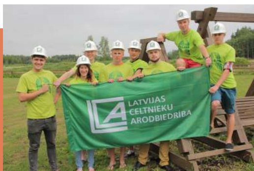
LCA Jauniešu padome „Pilons”.

Nākamais lielais darbības virziens - projekti. Jaunieši izstrādāja un iesniedza projektu „Jauno būvnieku tīkls” programmai „Jaunatne darbībā”. Tā mērķis - būvniecības nozares prestiža celšana jauniešu vidū. Projektu realizējam dažādos Latvijas reģionos - Rīgā, Daugavpilī, Liepājā, Zaļeniekos, Cēsis, Mālpilī. Katra reģiona arodskola veidoja reklāmu, lai celtu būvniecības nozares prestižu, atspoguļojot faktorus un faktus, kā to izdarīt tieši jauniešu skatījumā.