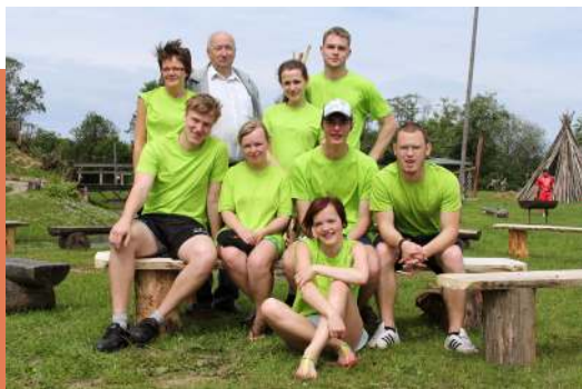
Jauniešu padomes "Pilons" komanda LBAS sporta spēlēs Turkalnē.