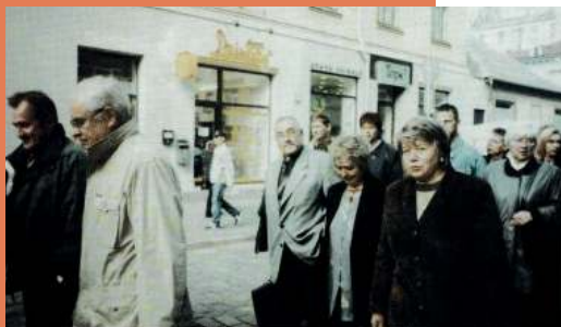
Pikets pie Saeimas.