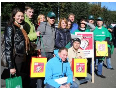
LBAS jauniešu dalība akcijā „Nē - bargai taupībai! Jā - izaugsmei!”.

Tikai atsevišķos gadījumos bijām gatavi iziet ielās LBAS organizētajās akcijās. Tāda notika 2010. gada septembrī pie Ministru kabineta, atbalstot Eiropas akciju – ar devīzi: „Nē – bargai taupībai! Jā – izaugsmei!”, novembrī pie Ministru kabineta, protestējot pret 2011. gada valsts budžetu. Decembrī piedalījāmies Tautas sapulcē pie Jāņa Raiņa pieminekļa, protestējot pret dzīves dārdzības kāpumu. Katra no akcijām pulcēja apmēram 500 dalībnieku.