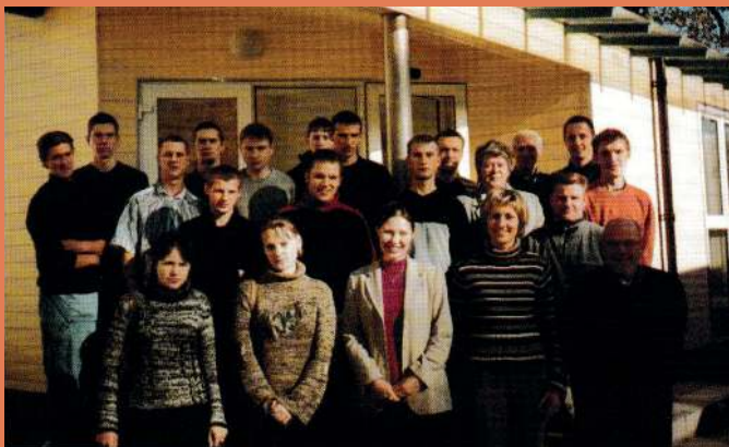
LCA Jauniešu padomes dibināšana Jūrmalā.