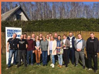
Baltijas Organizēšanas Alianses apmācības.

Būvniecības nozares ekspertu padomē (NEP) LCA līdzdarbojas jau kopš 2011. gada. Šīs padomes uzdevumos ir strādāt arī pie izglītības un nodarbinātības jautājumiem, bet tikai nozares ietvaros. Šī ir lielākā no ekspertu padomēm, jo nozare pārvalda 52 profesijas, ko var apgūt