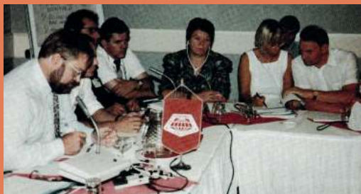
Ar IFBWW - Starptautisko Būvniecības un Kokapstrādes darbinieku federāciju.