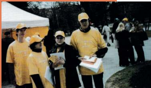
Vērmānes dārzs 1.maija svētkos.