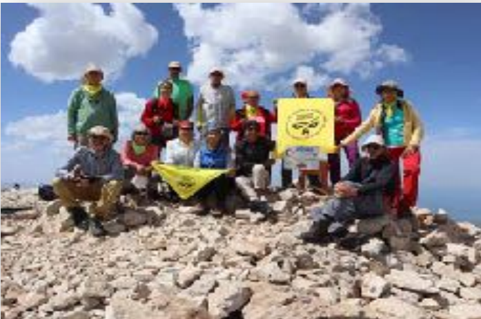
F: ARTOS DAĞI

-16 Haziran Pazar: 08.00 hareket.Gevaş bölgesinde bulunan ARTOS dağı tırmanışı. Minibüslerle