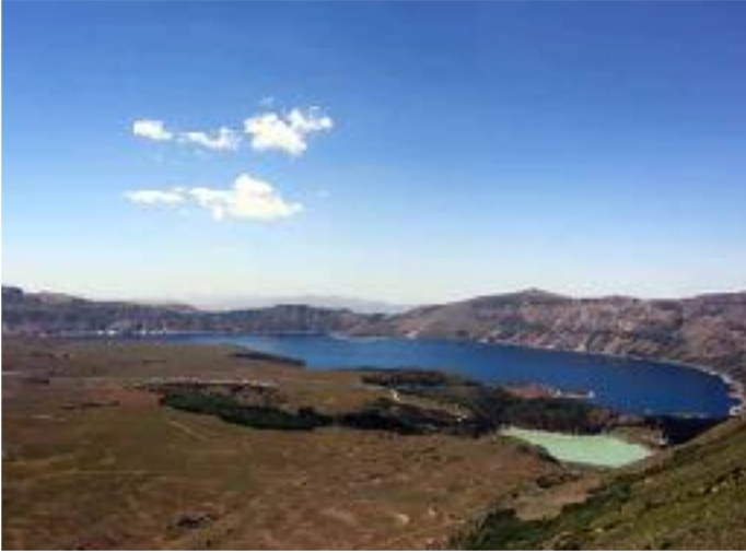
F: NEMRUT KALDERA YEŞİL GÖL

Nemrut Kalderasını minibüs ve yürüyerek dolaştık. En yüksek noktası