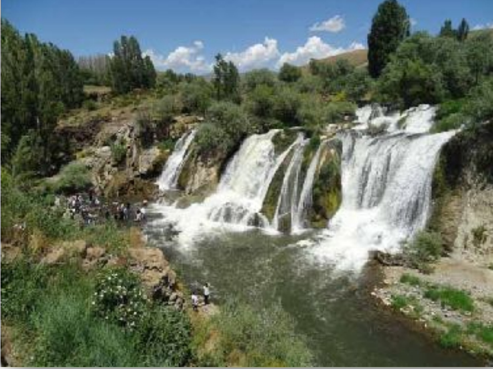
f: MURADIYE ŐELELESİ

alışverişlerden sonra aynı caddede Hacıođlu restoranına gittiler. Mumbarını beğenen de beğenmeyen de olmuş. Pasaja geri dönüp çok ucuz olan gorateks pantolon almak istedim ama beden uymadı.