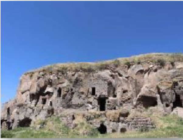
F: MADAVANS VADİSİ

sahibi otelin mevsiminin 1,5 ay olduğunu söyledi. Akşam topluca Ahlat yolu üzerinde 3 km. ilerde şehre bakan teraslı Seyricevaz restoranına gittik. Bayram nedeniyle az personel çalışıyordu, servis çok yavaştı. Çorba üzerine 3 lahmacun ve bir kaşarlı pideyi Yıldırım Güner ile paylaştık.