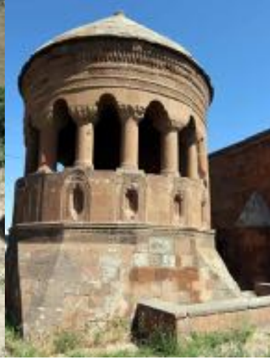
F: AHLAT MEZARLARI

Gezdiğimiz küçük müzesi panolarla burada bulunmuş devletlere ait bilgileri içeriyor. Sıra Madavans vadisinde bulunan ve Kapadokya'dakine benzer oyulmuş mağara evleri ziyaret. 17 km. gibi çok geniş bir alana yayılmış.