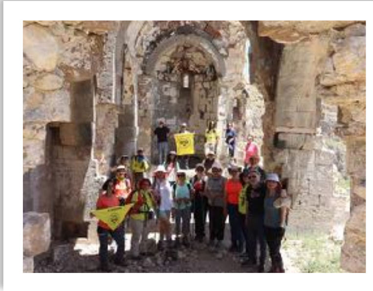
F :MUCİZELER KİLİSESİ

MUCİZELER MANASTIRI kilisesi uzaktan görülüyor. Hafif inişli çıkışlı bir yoldan 2240m.lik rakımda kiliseye ulaşıyoruz. Büyük ve uzunca bir kayısı ağacını kimin diktiğini konuşuyoruz. Ağacın gölgesinde kumanyalarımızı yiyoruz. Kilise, kuzey ve batı duvarları ile kubbenin yarısı yıkık olmasına karşın iyi durumda. Özellikle abidesi sağlam duruyor. Manastır kompleksi olarak 9. yy.da yapılan ermeni kilisesi, birçok kez yıkılıyor, yeniden yapılıyor,1895 de yağmalanıyor, 1915 de terk ediliyor.