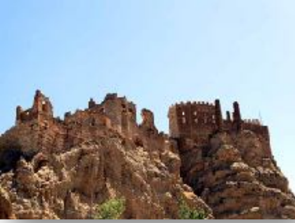
F: HOŞAP KALESİ ASIL ADI HOŞAB KALESİ

başka bir şey kalmamış olması Çavuştepe hayal kırıklığı yaratıyor. Eski bekçi emekli ama hala orada, hediyelik eşya satıyor. Urartuca bir yazıtı bize tercüme etti. Bir ara o çok popüler olmuştu Urartuca bildiği için. Urartuca Kafkas dil ailesine ait bir dil. Kalenin önemi, İran yolu üzerinde stratejik, idari, askeri ve ticari bir merkez olmasıydı.