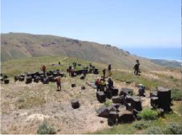
F: KEF KALESİ KALINTILARI

Süphan dağının bazalt lav akıntılarının iri taşlarıyla yapılmış kale ve saray kompleksinden oluşmuş. 3 hektarlık bir alanı kaplıyormuş. İri blok kaya temel taşlarından başka bir şey yok ama yine de görsel olarak ilginç.