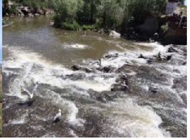
F: NCİ KEFALİ GÖÇÜ VE MARTILAR

MUCİZELER MANASTIRI kilisesi uzaktan görülüyor. Hafif inişli çıkışlı bir yoldan 2240m.lik rakımda kiliseye ulaşıyoruz. Büyük ve uzunca bir kayısı ağacını kimin diktiğini konuşuyoruz. Ağacın gölgesinde kumanyalarımızı yiyoruz. Kilise, kuzey ve batı duvarları ile kubbenin yarısı yıkık olmasına karşın iyi durumda. Özellikle abidesi sağlam duruyor. Manastır kompleksi olarak 9. yy.da yapılan ermeni kilisesi, birçok kez yıkılıyor, yeniden yapılıyor,1895 de yağmalanıyor, 1915 de terk ediliyor.