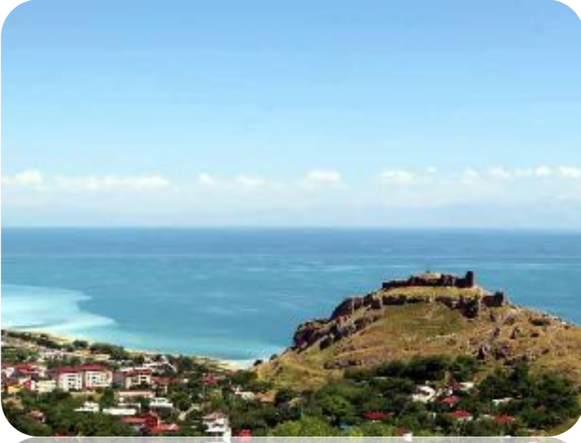
F: ADİLVEVAZ KALESİ

manzarası güzel. Yürüyerek şehre iniyoruz Saat daha erken, Ceviz alıyoruz. Yörelisi aldığımız ceviz Azerbaycan'dan geliyor, yöre cevizi bu mevsime kalmaz diyor. Yine de aldığımız cevizden memnunuz.