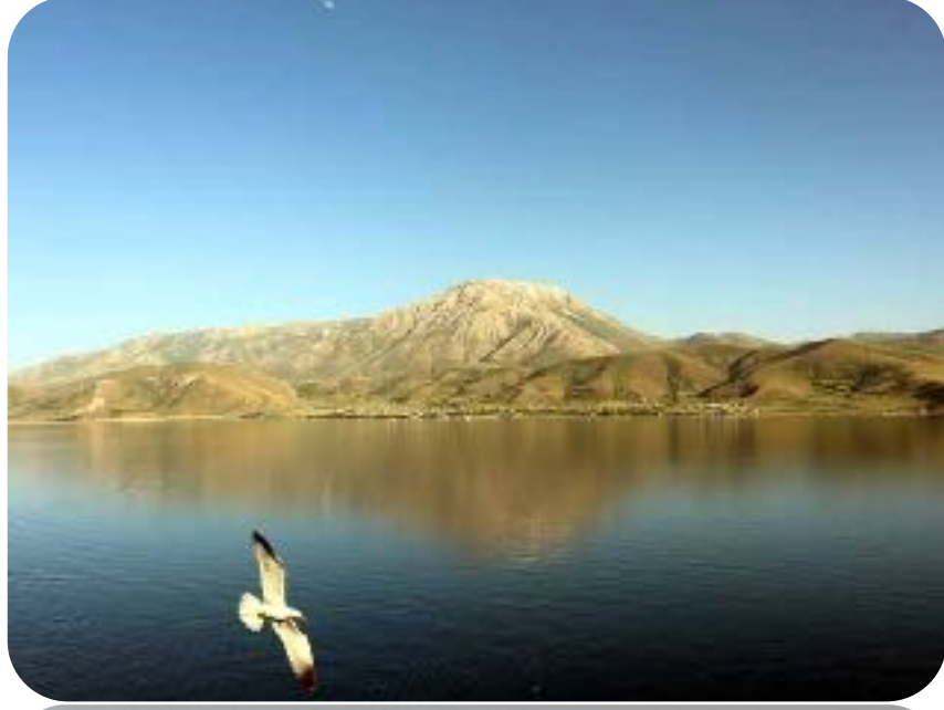
F: AKDAMAR ADASINDAN ARTOS DAĞI

Dönüşte, iki gece kalacağımız Tatvan'da ki Mostar oteline hareket ettik. Otel 3 yıldızlı. Buzdolabı fişi üzerinde ama anlayamadığımız bir nedenden çalışmıyor. Tur boyunca kaldığımız otellerde odalara girilip havlu değişimi yapılmadı. Memnun olmayanlar vardır ama ben fuzuli israfa karşı olduğum için normal karşıladım. Dışarı çıkıp ana caddesinde bir tur attım, çok kalabalıktı ilçe. Ender yediğim bir yemek, dürümlü tantuni yedim. Çok tantuni restoranı ve seyyar satıcısı var. Paralel caddedeki sahili ise ertesi güne bıraktım.