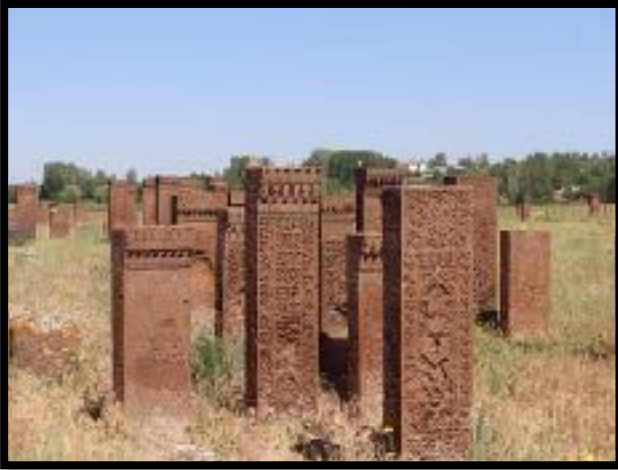
F: AHLAT MEZAR TAŞLARI

-19 Haziran Çarşamba: İstikametimiz 42 km. lik mesafede AHLAT tarihi Kümbetleri ve çok önemli mezarlıklar.Zamanında Buhara ve Belh ile 3 önemli sanat ve uygarlık kenti Ahlattan geriye kalanlar