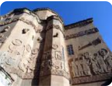
F: AKDAMAR KİLİSESİ

üzerinde piramidal külah (Selçuklu kümbetlerini andırır) var. Uzun yüz tipleri, iri gözler 9-10 yy Abbasi duvar resimlerinde de var.