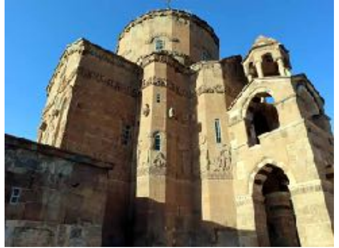
F: AKDAMAR KİLİSESİ

Yapılar topluluğu M.S. 915-921 arasında Ermeni kralı 2. Gagik tarafından saray, kilise, surlardan oluşan bir kompleks olarak yapıldı. Arap istilaları iki asır sürdü. Zamanla diğer yapılar kayboldu. Yalnızca kilise ayakta kaldı ve çok kez onarım gördü. 34 yıl önce iç kısımlar kilitli ve görülemiyordu, şu an açık. Merkezi kubbeli, dıştan haç veya dört yonca yapraklı yapının içi freskler, dışı ise figürlü kabartmalar (rölyefler) la kaplı. Eski ve yeni ahitten sahneler, saray yaşantısı, av, günlük hayat, hayvan ve bitki motifleri dış cepheyi tümüyle kaplamış. Mimari ile figürlü kabartma plastik uyumu göze çarpıyor. Yuvarlak karnak dışta on altıgen ve