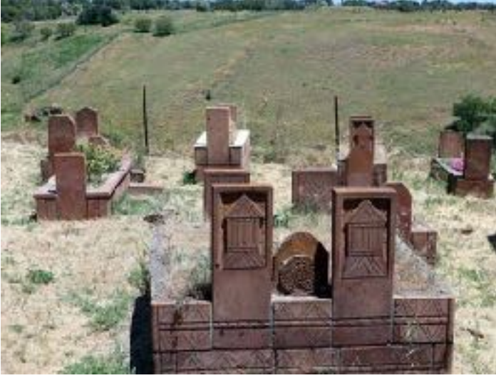
F: AHLAT EMİR BAYINDIR KÜMBETİ