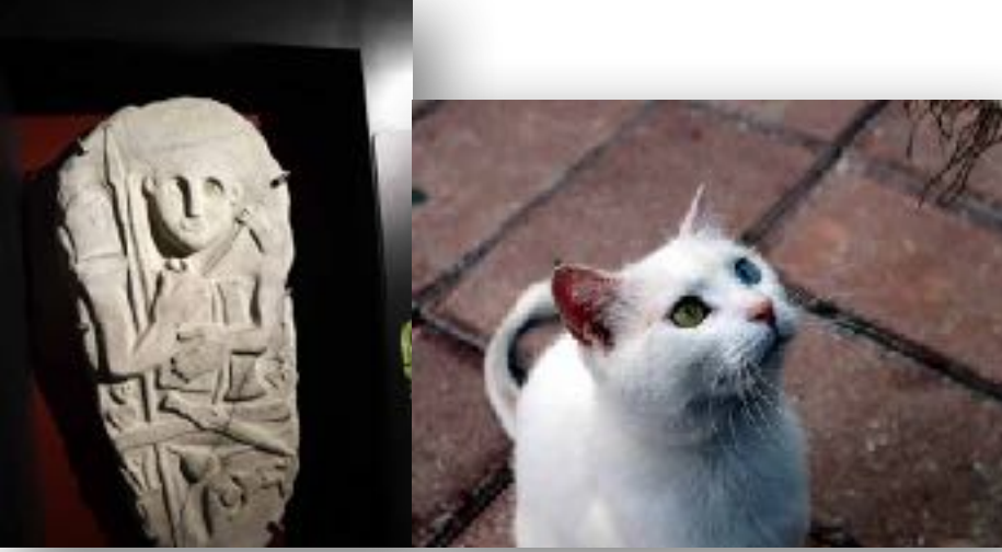
F: KEDİ EVİ

İkinci uğrak yerimiz KEDİ EVİ oldu. Yeşil ve mavi gözlü beyaz Van kedileri telle çevrili bir alanda dolaşıyorlardı. Ufak bir ücret karşılığında içeri girilebiliyordu. Uysal kediler kucağa alınıp fotoğraf çekilebiliyordu. Aynı yerde hediyecek bir eşya dükkânı hizmet veriyordu.