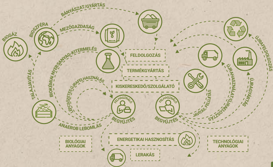
Ábra: A körforgásos gazdaság működési modelljét bemutató ún. „pillangóábra”

Nem. Mára általánosan elfogadottá vált, hogy a hulladék nagy része érték, amelyet nem szabad veszni hagyni. Ezt képviseli a körforgásos gazdaság, amelynek gyakorlati megvalósítása biztosítja azt, hogy a hulladékká váló anyagok megfelelő minőségben, mennyiségben kerülhessenek vissza a gazdaságba. Ehhez viszont ismerni kell a csomagolás teljes életútját, ami lehetővé teszi az anyagok megfelelő módon történő hasznosulását.