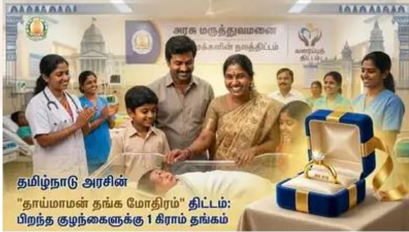
தமிழ்நாடு அரசின் "தாய்மாமன் தங்க மோதிரம்" திட்டம்: பிறந்த குழந்தைகளுக்கு 1 கிராம் தங்கம்