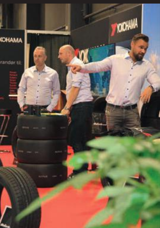
Yokohama deltog for første gang på au2messen og trak mange besøgende til standen.

Messeballet blev åbnet i slutningen af oktober måned, hvor au2parts traditionen blev genoptaget efter en påtvunget pause i 2020, hvor corona-situationen også der havde blokeret for dette årlige arrangement. Derfor kunne det klart fornemmes, at det for mange var et glædelig gensyn mellem udstillere og besøgende.