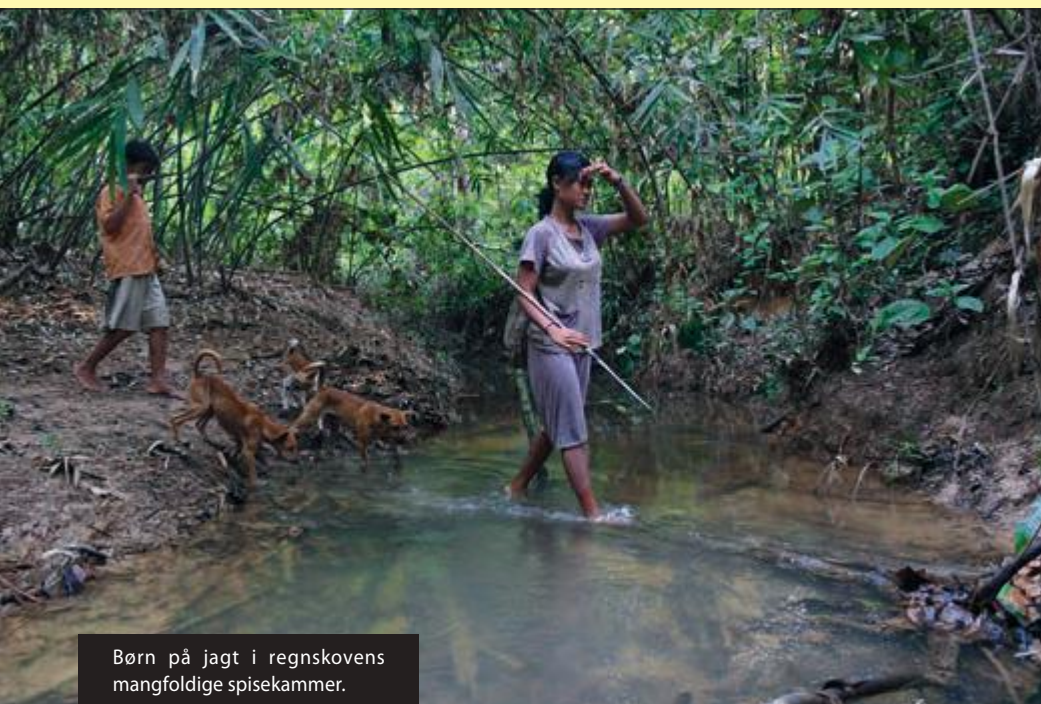
Børn på jagt i regnskovens mangfoldige spisekammer.

I projektet indgår også beskyttelse af regnskoven ved overvågning og direkte kontrol af skovområdet samt beskyttelse og pleje af regnskovens dyr ved optælling og overvågning af de mest truede dyrearter såsom Sumatran-tigern, hornbillen, den tykbeklædte bladflugl og den sorthåandede gibbon, hvilket skal involvere lokalsamfundene i aktiv beskyttelse af skov og biodiversitet.