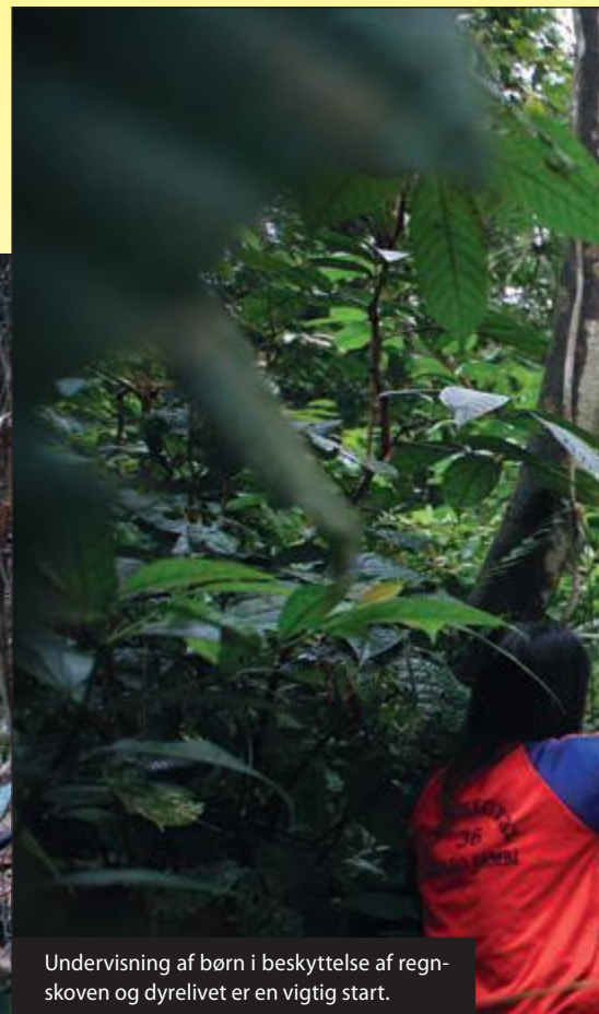
Undervisning af børn i beskyttelse af regnskoven og dyrelivet er en vigtig start.