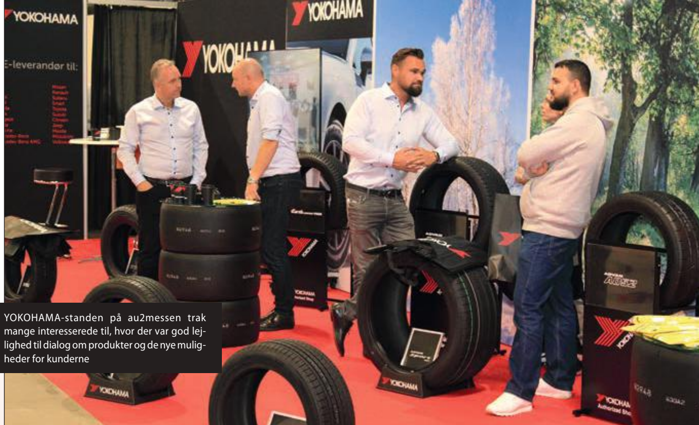
YOKOHAMA-standen på au2-messen trak mange interesserede til, hvor der var god lejlighed til dialog om produkter og de nye muligheder for kunderne