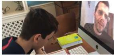
Средношколците бараат алтернативи за учење од дома, системот не нуди онлајн настава