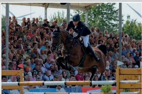
2018 André Thieme auf Aretino