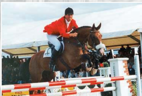
1994 Ludger Beerbaum auf Geylord