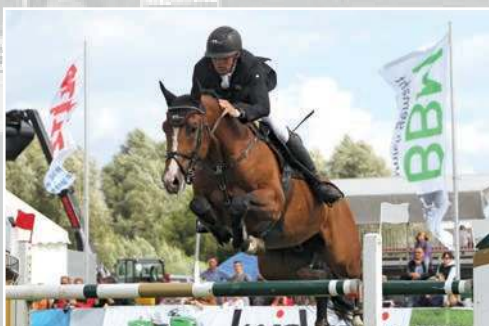
2017 André Thieme auf Contadur