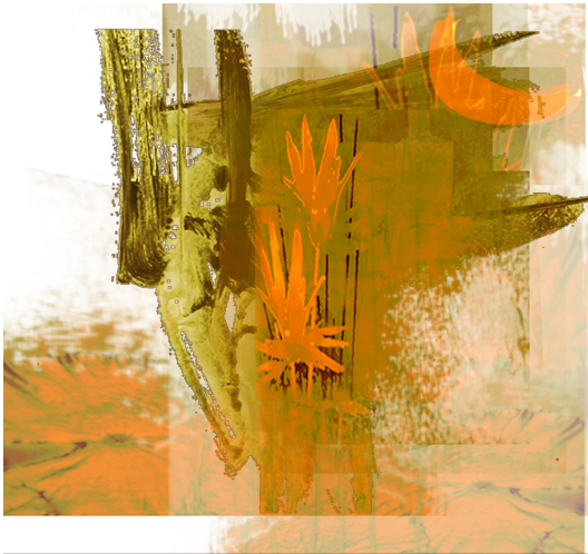
Tranh phụ bản – Doãn Quốc Vinh