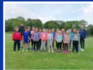
Kinderleichtathletik 8-9 Jahre U10

Trainingszeiten: Mittwoch 17:30-18:30 Uhr