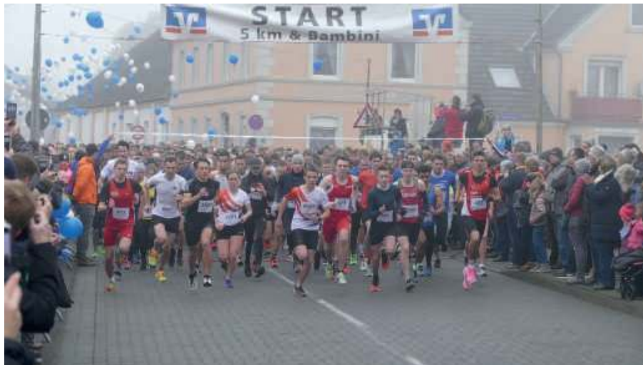
Wir hoffen alle, dass der Startschuss am Silvestertag erfolgen wird und es Höchstleistungen auf und neben der Strecke gibt!

Nach den derzeitigen Planungen werden alle Läufe angeboten. Anmeldestart wird vermutlich der 01. Oktober 2021 sein.