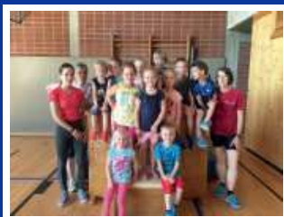
Kinderturnen 4-5 Jahre U6

Trainingszeiten: Mittwoch 16:30-17:30 Uhr