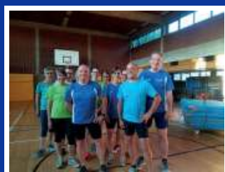
Coretraining(Tiefenmuskulaturtraining) ab 18 Jahren