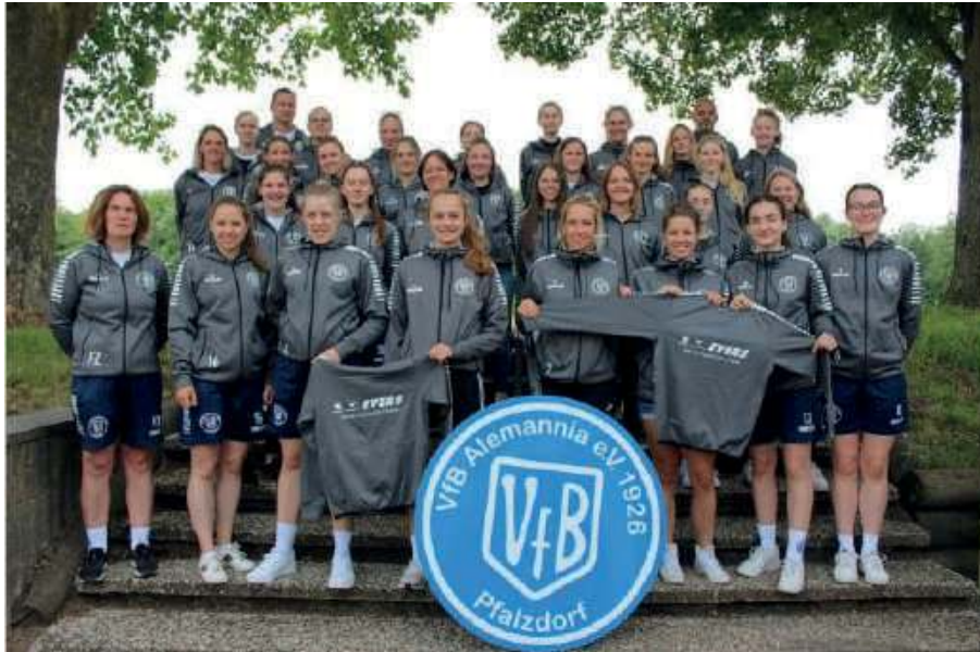
Die Damen mit neuen Präsentationsjacken. Gesponsert wurden sie vom Autohaus Evers in Kleve.

und vermitteln eine Leidenschaft, die bestens zur Mannschaft passt.