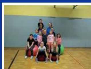
Leichtathletik 8-9 Jahre U10