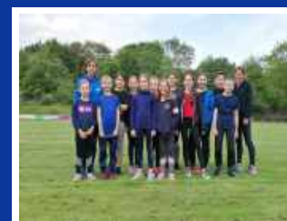
Leichtathletik Lauf 10-13 Jahre U12/14

Trainingszeiten: Mittwoch 17:30-18:30 Uhr