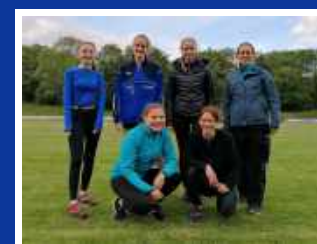
Leichtathletik Lauf Mittel- und Langstrecke ab 14 Jahren

Trainingszeiten: Montag 18:30-20:00 Uhr Mittwoch 18:30-20:00 Uhr