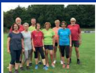
Fit bleiben durch Bewegung Ü50