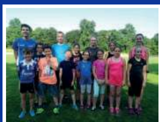
Leichtathletik Mehrkampf 10-13 Jahre U12/14

Trainingszeiten: Winterzeit Freitag 18:00-19:30 Uhr