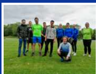
Leichtathletik Mehrkampf 14-19 Jahre U16-U20

Trainingszeiten: Montag 18:00-19:30 Uhr Mittwoch 18:30-19:30 Uhr