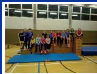
Leichtathletik 10/11 Jahre U12