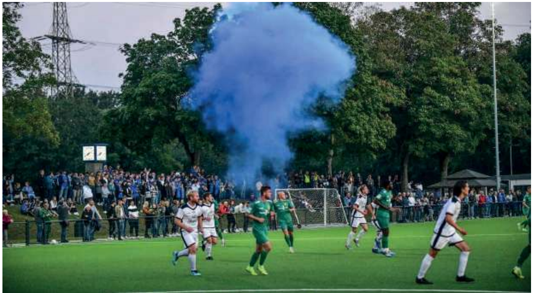
Das Niederrheinpokalspiel zwischen der Ersten und dem SV Straelen zog die Massen an. Die Pfalzdorfer Schlachtenbummler versammelten sich unter der altherwürdigen Uhr des Heribert-Ramrath-Stadions.

Am frühen Morgen herrschte schon reges Treiben auf im Heribert-Ramrath-Stadion. Die „Rentnerbande“ sorgte für den letzten Feinschliff und putzte die Sportanlage für das bevorstehende Highlight heraus.