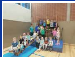
Spielerische Leichtathletik 6-7 Jahre U8

Trainingszeiten: Mittwoch 17:30-18:30 Uhr