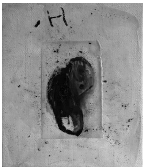
Zatišna lega , 1999, olje, vosek na platnu, 35 x 30 cm