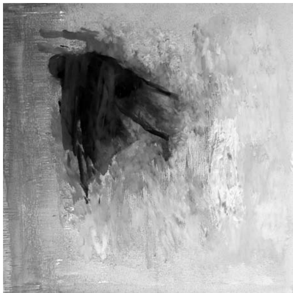
Za vasjo , 2016, 90 x 90 cm, olje na platnu