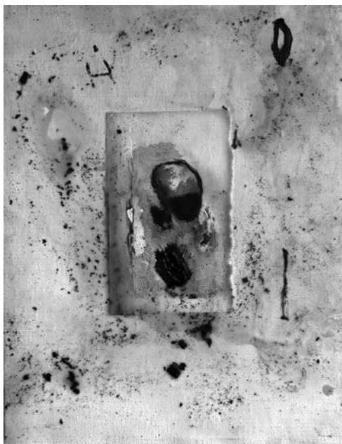
Zatišna lega , 1999, olje, vosek na platnu, 40 x 30 cm