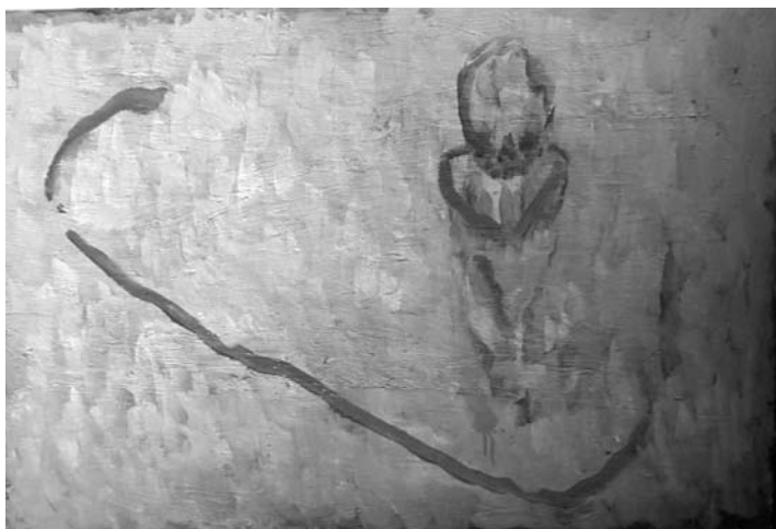
Bonnardova kopel , 2010, 60 x 90 cm, olje na platnu