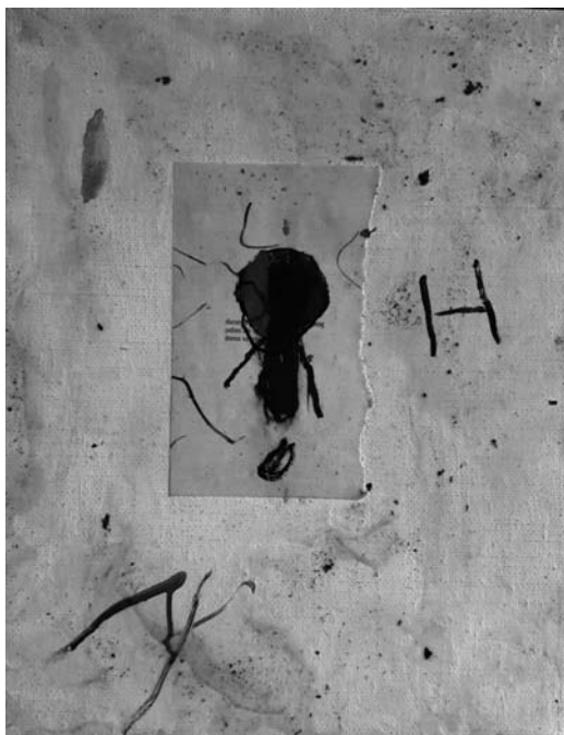
Zatišna lega , 1999, olje, vosek na platnu, 40 x 30 cm