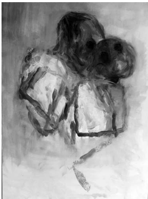
Nočne prikazni , 2019, 80 x 60 cm, olje na platnu