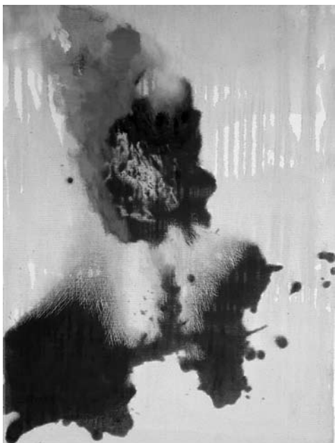
Odtokanje , 2015, 90 x 60 cm, olje na platnu