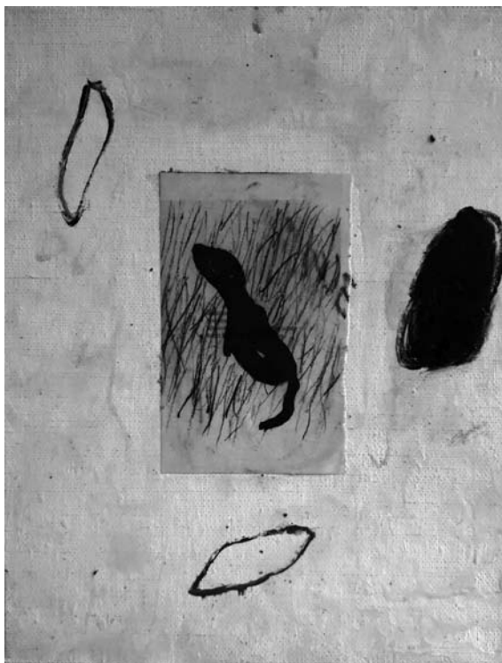
Zatišna lega , 1999, olje, vosek na platnu, 40 x 30 cm