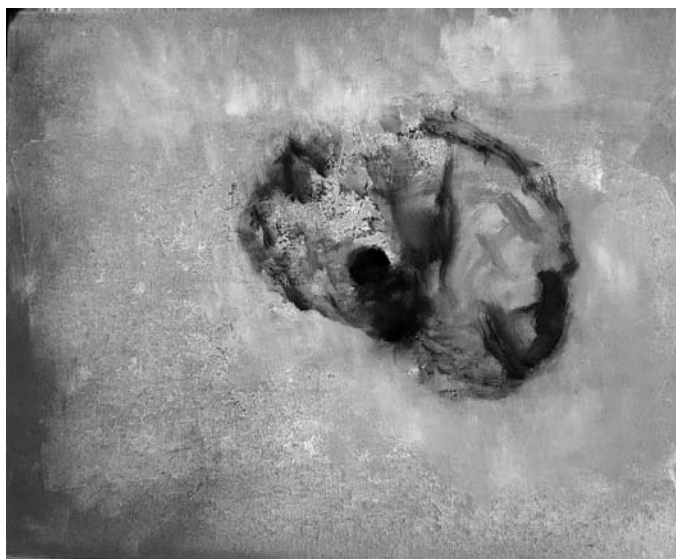
Klobčič , 2018, 45 x 55 cm, olje na platnu