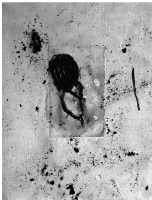
Zatišna lega , 1999, olje, vosek na platnu, 40 x 30 cm