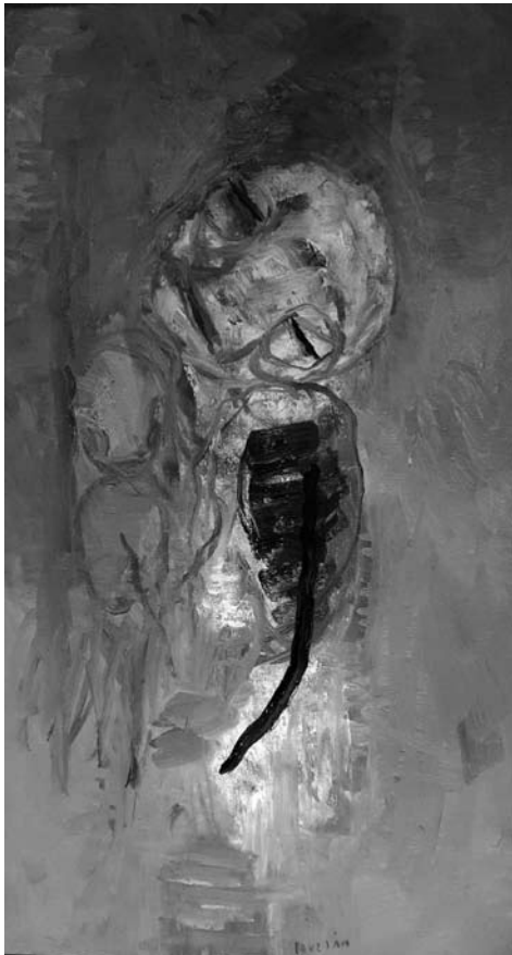
Stopil si na vodo, da bi pobral svoje ime, 1995, 110 x 60 cm, olje na platnu