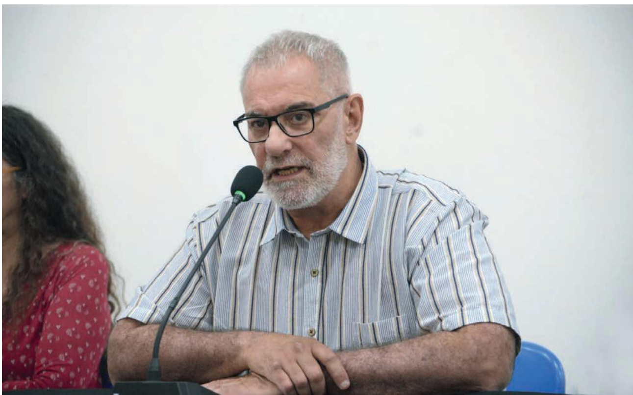
“La vivienda sigue siendo tratada como una mercancía y no como un derecho. Está al servicio de la especulación y de la acumulación de capital”

Las expectativas siempre se renuevan con cada gobierno, pero la realidad es que seguimos teniendo recursos muy limitados para atender las necesidades existentes”, afirmó.