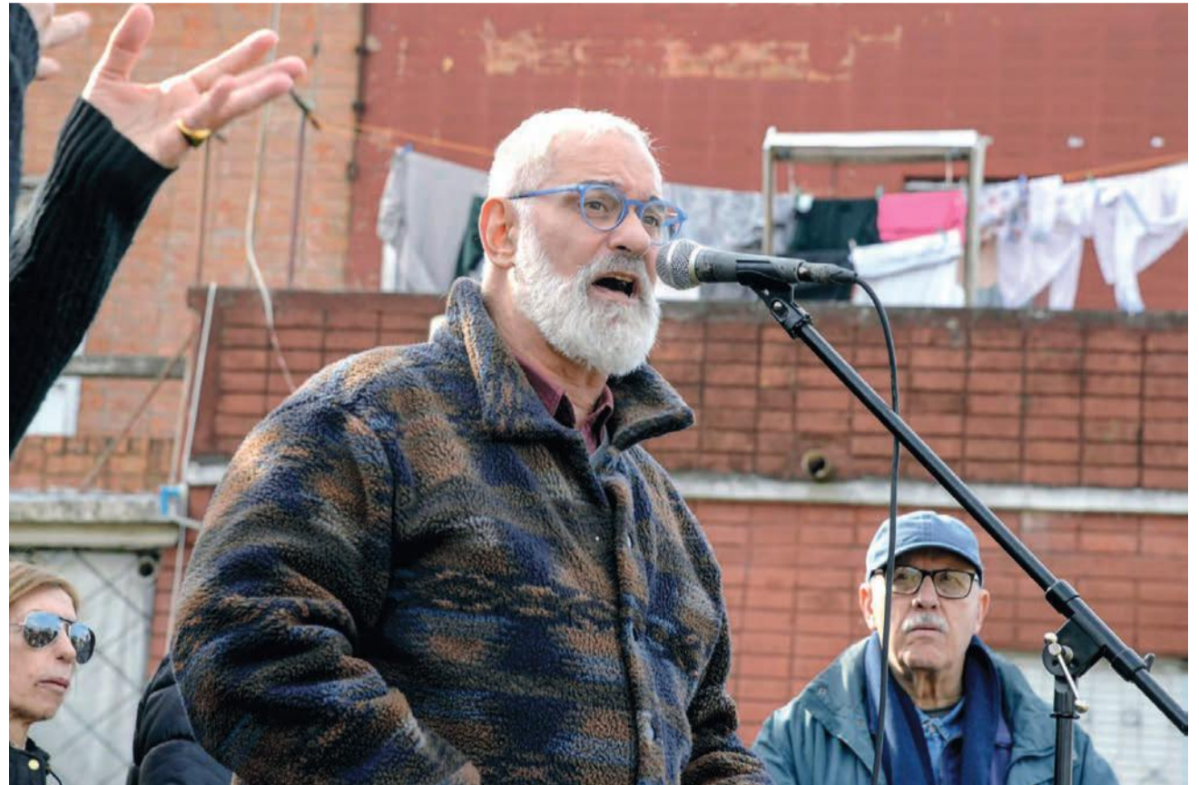
“El cooperativismo promueve la igualdad, la participación, la democracia directa, la autogestión y el trabajo solidario”, afirmó Cal

Cal sostuvo que la expansión de la tecnología militar y la persistencia de conflictos internacionales colocan a la humanidad frente a riesgos inéditos.