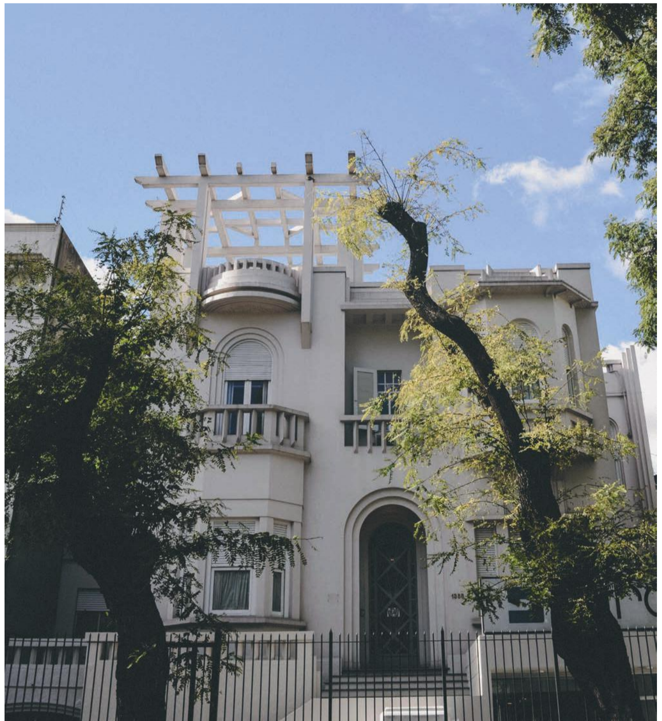
Casa Central Surco Seguros

La innovación tiene sentido cuando contribuye a fortalecer la confianza y a brindar un mejor servicio a nuestros socios y clientes.