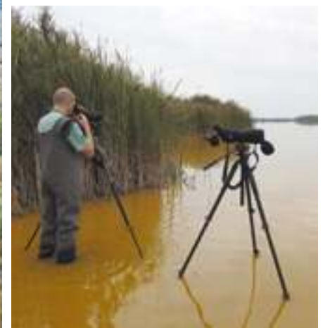
A terület madárvilágát folyamatosan monitorozzuk.

A nádasok fészkelő közösségében ott találjuk a legfontosabb fokozottan védett gémféléinket, mint a nagy kócsag, a kis kócsag, a vörös gém, az üstökös gém, a bakcsó, a pocgém (törpegém), és a bölömbika. Egy részük telepesen költ, kisebb részük szétszórtan. Ezekhez társul még két faj, a kanalasgém és kivételes években a batla.