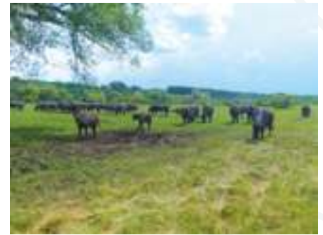
Házi bivalyok kezelik a gyepeket a Hajósi kaszálók Természetvédelmi Területen

A natúrpark létrehozásának lehetőségét a térségben természetközeli és ökológiai gazdálkodást folytató fiatal gazdálkodók vetették fel, akik az elmúlt években következetesen dolgoztak az Órjeg gazdag természeti és táji örökségének megőrzéséért. Tevékenységük középpontjában a természetközeli gazdálkodás, azon belül is kiemelten a legeltetéses állattartás áll, amihez szervesen kapcsolódik a védett természeti értékek megőrzése és az egészséges helyi termékek előállítása. Mindehhez alapot jelenthet a térség vízszabályozásának az újragondolása, a vízviszatarítás lehetőségének a megteremtése. E tevékeny-