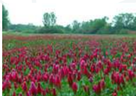
A bíborherét takarmánynövényként, takarónövényként és zöldtrágyaként is alkalmazzák. Virágzárkor csodálatos látvány.

nigra) is. A füves élőhely több védett növényfaj, így például a még viszonylag gyakori mocsári kosbor ( Orchis palustris ) menedéke. A békakonty ( Listera ovata ) megmaradt kisebb állományát nemrégén fedezték fel a helyi szakemberek.