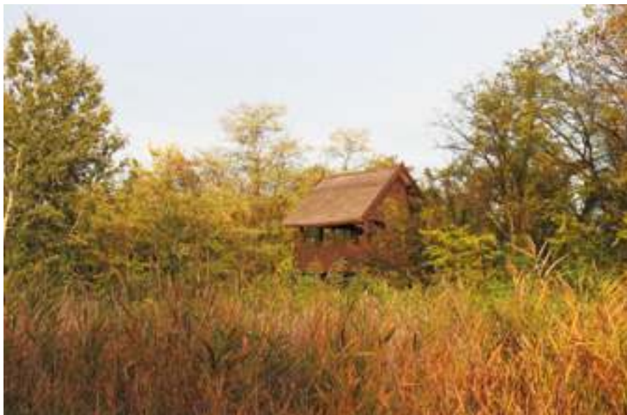
Ha a Péteri-tóhoz megyünk, a távcsövet ne hagyjuk otthon. A Vöcsök-tanösvényen található kilátóról a nyílt víz madarait szemlélhetjük.

nyilvánítását követően kezdett magához térni. A Péteri-tavon már a szemünk láttára, az 1970-es években telepedett meg újra, s ettől kezdve a vidra kis számban folyamatosan előfordul.