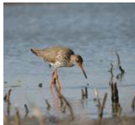
Nem túl nagy állománnyal ugyan, de rendszeresen költ itt a piroslábú cankó.

A vízi élőhelyek változatossága a halfauna gazdagságát is maga után hozza. Magam 18 fajt mutattam ki a területről, de ennél nyilvánvalóan több is él a vizekben. Legértékesebbek a mocsaras, lápos részeken meg-