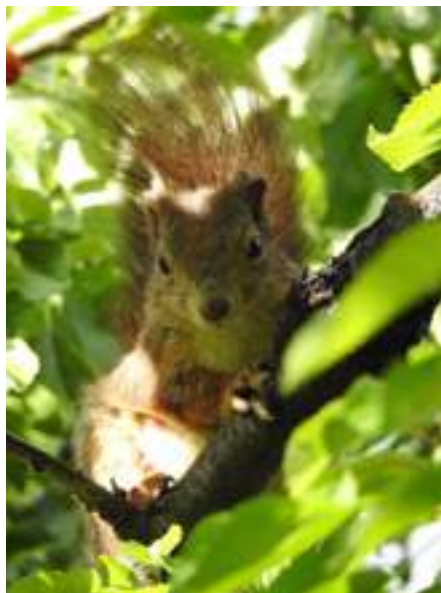
Egyre gyakoribb a vörös mókus a tó körül.

Hatalmas értéket képvisel ez a sok fokozottan védett gázló madár itt egy helyen. A gémtelpek vonzáskörzetében rak fészket nádasaink egyedüli ragadozó madara, a barna rétihéja. A ragadozókat képviselik még a táplálkozni idejéről rétisasok és a rendszeresen költő kabasólyom is.