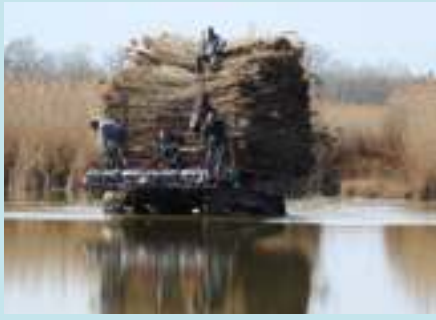
A nádas visszaszorítására nagy szükség van a tavon.

élőhelytípus találkozása a tó. Az északi vége az ún. láp fő , a tó nagy része pedig a székalj . A lápi jelleg ugyan megtalálható (bokorfűzes, kékperje, zsombéksásos, lápi csalán), de alapvetően a sziki jelleg dominál. Ugyan a jellegzetes sziki fészkelő közösségek már gyakorlatilag eltűntek innen, de jó területkezeléssel részben még vissza lehet hozni. Ehhez megfelelő vízviszonyok is szükségesek.