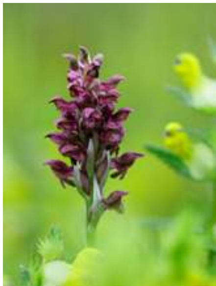
A májusban nyíló poloskaszagú kosbor viszonylag gyakori orchideafaj a tó környéki réteken.

telepedő fajok, mint a lápi póc és a réticsík. Utóbbi az élőhelye időszakos kiszáradása esetén az iszapba ágyazza el magát, s ott nedves körülmények esetén heteket is átvészel.