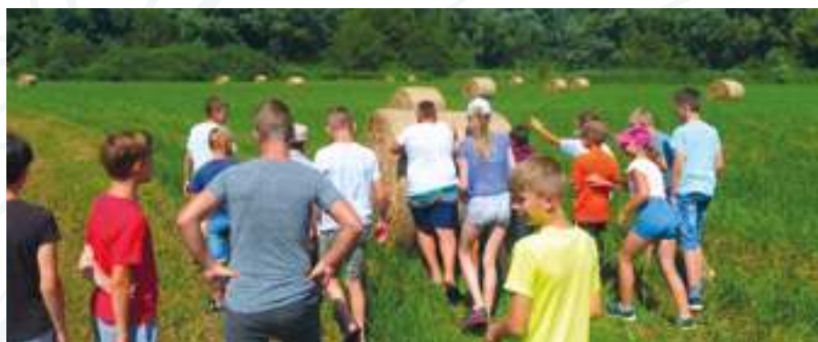
Egy agrotúra résztvevői akár bálagurító-versenyen is részt vehetnek

állítására láthatunk már szép eredményeket felmutató gazdálkodói kísérletet. Az itteni fajgazdag gyepterületeket az erdő- és biogazdálkodással foglalkozó család – a védelmi és gazdálkodói szempontokat egyaránt figyelembe véve – aberdeen angus szarvasmarha állománnyal kezeli. Ezen a gyepon néhány évvel ezelőtt még tömeges volt a gyalogakác. Ettől az inváziós jellegű cserjétől több éves szárzúzással kellett visszahódítani az egykori legelőt, amelyet a legelő szarvasmarhák ma már jó természeti állapotban tartanak. Nyár elején, főleg hajnalban a haris ( Crex crex ) érdekes hangja mutatja, hogy bizony jó néhány pár költ a területen. Az itteni gyepek fontos táplálkozóterületei a fekete gólyának ( Ciconia