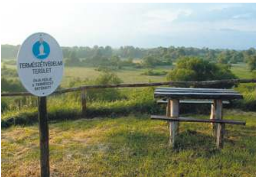
Órjegyi látkép a magaspartról