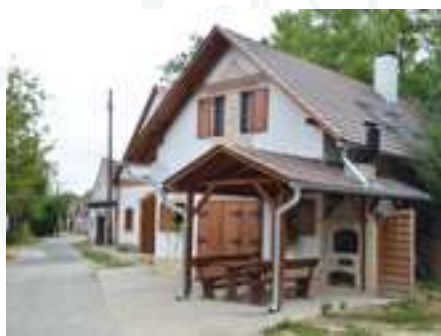
Császártöltés pincesorja szervesen beépül a faluba

Az egykori érseki kastélyáról és pincefalujáról méltán híres Hajós külterületén érdemes felkeresni a Szalczér Birtokot, ahol az egykori mozaikos karakterű örjegi kultúrtáj vissza-