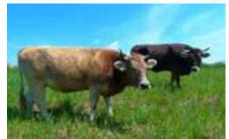
Kárpáti borzderesek kezelik a homoki gyepeket Homokmégy határában

A natúrparkot létrehozó szakmai csoport a térségfejlesztés egyik kiemelt irányának a természetkímélő gazdálkodásból származó, minőségi helyi termékek gazdag kínálatán és autentikus vidéki jellegű szolgáltatásokon alapuló agroturizmus feltételeinek megteremtését tartja. A megvalósítás gerincét egy natúrparki mintagazdaság-hálózat képezi, amely a természetkímélő gazdálkodást folytató gazdaságokat, a kézműves termékeket előállító vagy szolgáltató, turizmusra fogékony vállalkozókat fogja össze. A mintagazdaságokat gyalogos, kerékpáros és lovas használatra specializált, egyfajta nagyléptékű