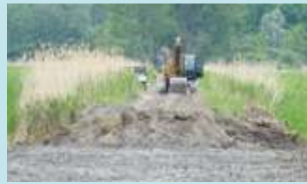
Az 1-es és 2-es tó közötti töltés elbontása.

A tó északi oldálán épül egy új kilátó, ahonnan gyönyörű panoráma tárul majd a látogatók szeme elé. Az északnyugati oldalon egy új, 2000 m-es tanösvény készül, melynek végén egy 150 m hosszú pallósor vezet majd be a nádason keresztül egy nyolcszögletű madármegfigyelő leshez, hogy a tó nyüzsgő madárvilágába közelebbi bepillantást nyerjünk.