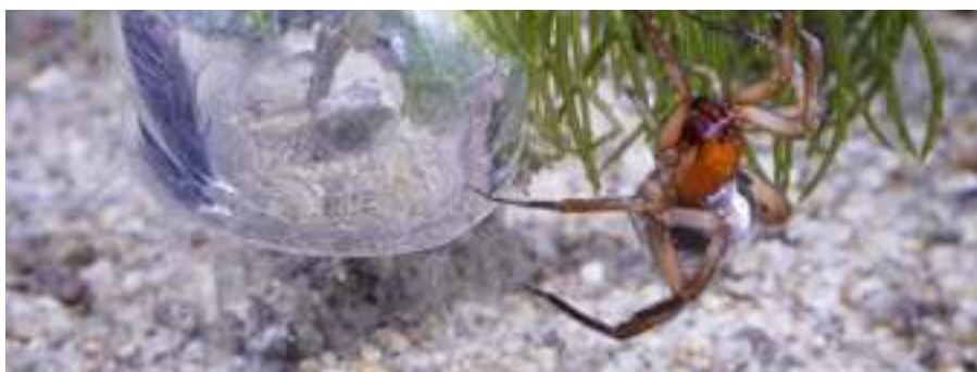
A kecskeméti rajzfilmstúdióban készült Vízipók Csodapók hősenek modellje, a búvárpók az egyetlen pókfaj, amely légnadrágja és búvárharangja segítségével szinte egész életét a víz alatt tölti.

A pókok egyébként nem is egy, hanem hétféle selymet tudnak előállítani. A testük belsejében ún. szövőmirigyek találhatók, melyek folyékony pókselymet készítenek. A folyadék akkor szilárdul meg, amikor átpréselik a potrohuk végén lévő szövőszemölcszeiken. Ilyenkor átrendeződnek a folyadékban lévő fehérjemolekulák és létrejön a szilárd pókfonal. A legtöbb póknak három pár szövőszemölcsze van, amelyeket aszerint mozgat, hogy milyen szájakat akar előállítani: ha közelíti őket egymáshoz, akkor egy vastagabb fonal keletkezik, ha pedig távolabb tartja, akkor több finom szál távozik a testéből. A pókselymet maguk a pókok is igen sokféle módon használják: van, hogy a zsákmány megfogására és becsomagolására, de otthonuk bélelésére, víz alatti búvárharang készítésére, esetleg levegőben való utazásra is készítenek pókfonalat. A zsákmányolásra szánt szájakat egyes pókok