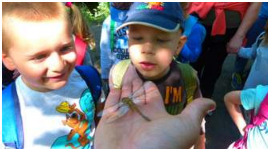
Szakvezetési túra a Vörös-mocsár tanösvényen

tanösvényként is funkcionáló közlekedési hálózat kötné össze. Cél, hogy minden mintagazdaság legalább egy teljes napos, egyedi jellegű programot tudjon biztosítani az érdeklődőknek, további lehetőségként ajánlva a következő natúrparki bio- és öko-gazdaság felkeresését.