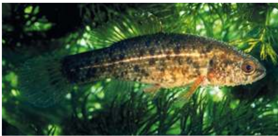
A tó egyik értékes fajtát, a fokozottan védett lápi pócot sajnos már nem észleljük az utóbbi években.

Az itt megtalálható 36 emlősfaj közül a legértékesebbek természetesen a fokozottan védettek, mint a vidra. El kell róla mondani, hogy korábbi vadászhatósága következtében állománya az 1950-es években a kipusztulás szélére került országosan, s csak védetté