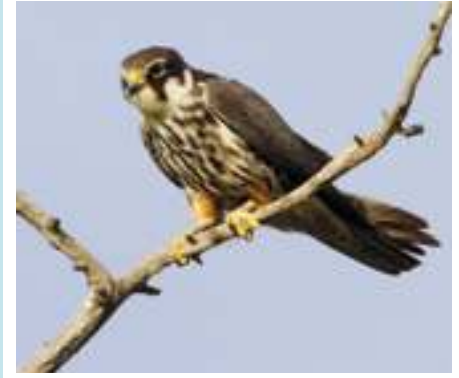
A kabasólyom rendszeresen költ a tónál.

A védelem alatt álló Péteri-tavon változatos élőhelyek találhatók viszonylag kis területen belül, ami fajgazdag élővilágot eredményez. A területen ezideig észlelt madarak fajszáma 262, melyből 123 költ is a térségben. Három