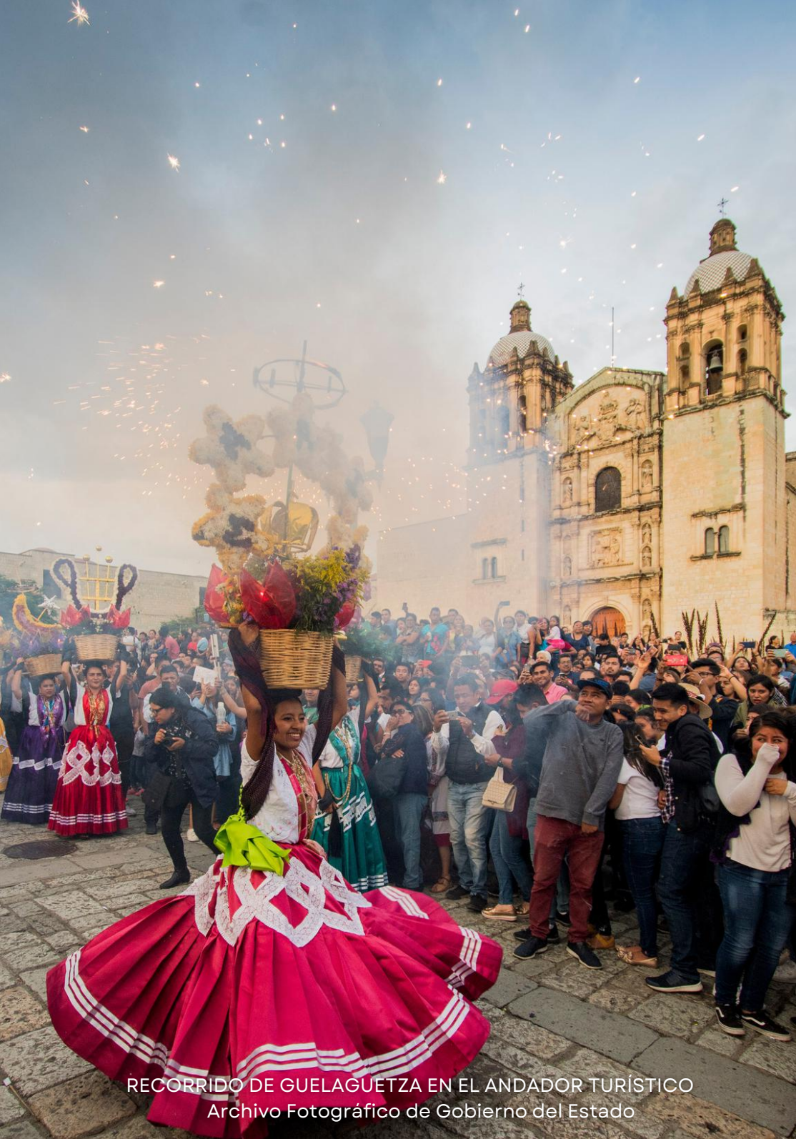
RECORRIDO DE GUELAGUETZA EN EL ANDADOR TURÍSTICO