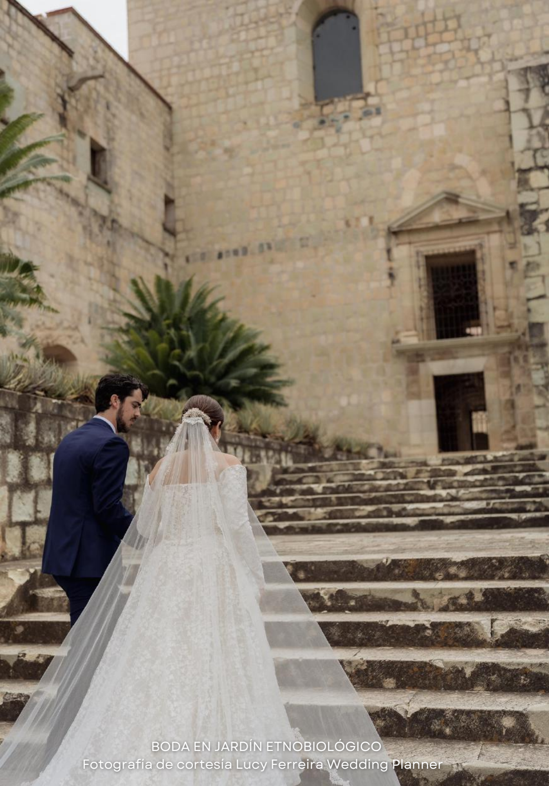
BODA EN JARDÍN ETNOBIOLÓGICO