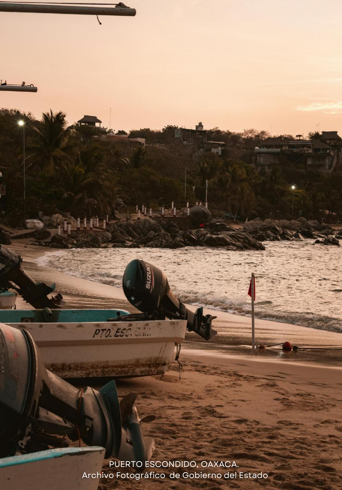
PUERTO ESCONDIDO, OAXACA.