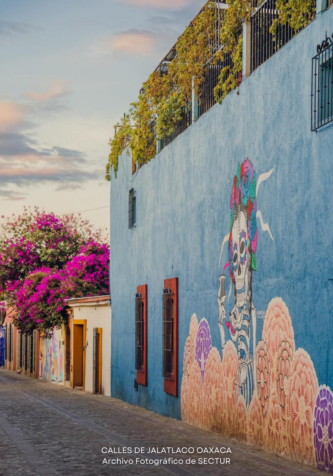
CALLES DE JALATLACO OAXACA