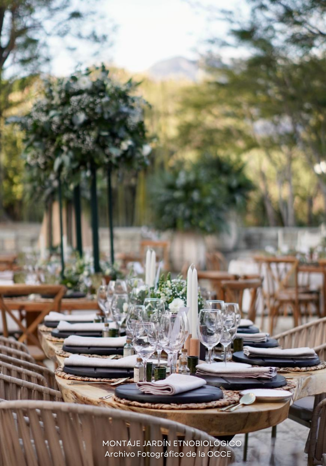
MONTAJE JARDÍN ETNOBIOLÓGICO