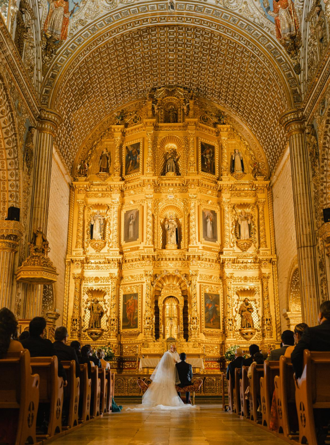
INTERIOR DEL TEMPLO DE SANTO DOMINGO DE GUZMÁN