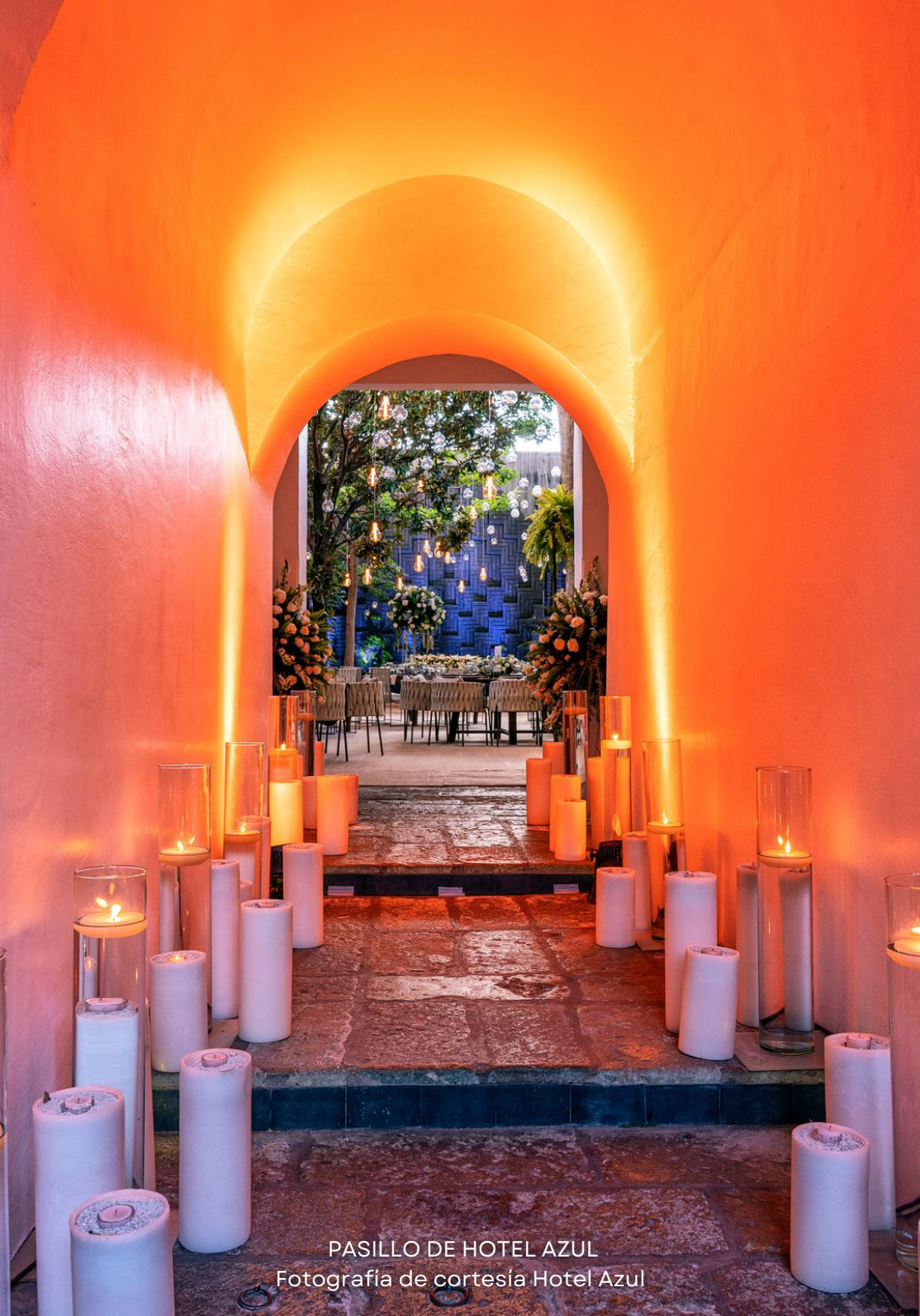
PASILLO DE HOTEL AZUL