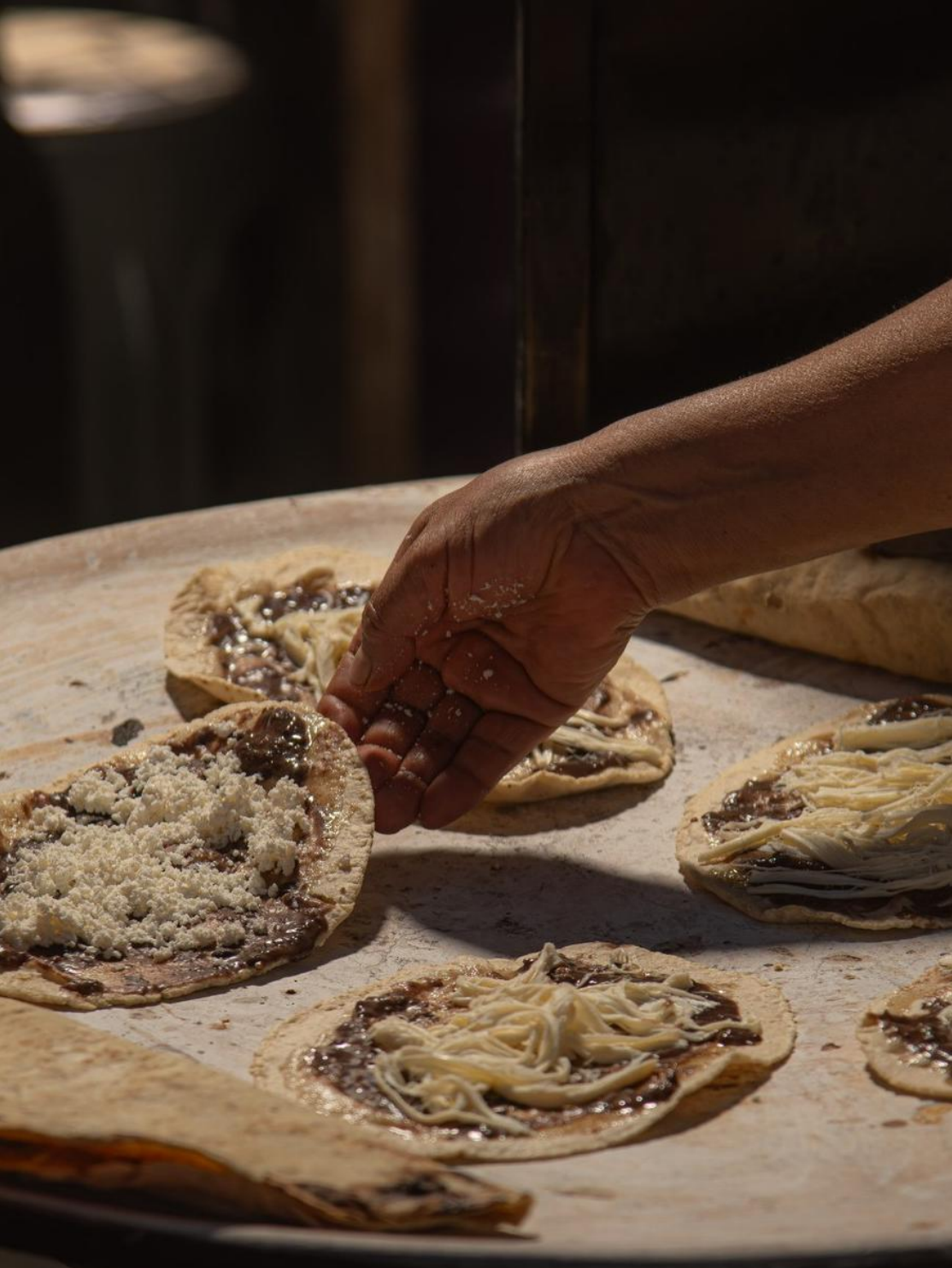
COCINA TRADICIONAL - GASTRONOMÍA