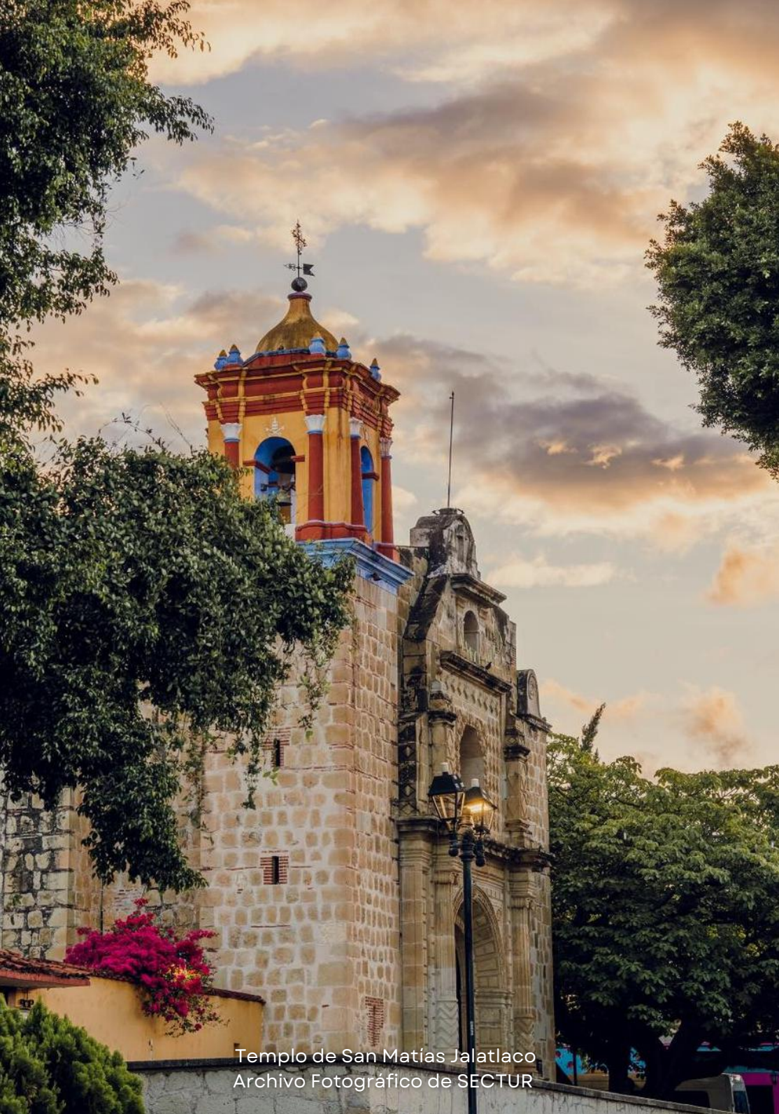
Templo de San Matías Jalatlaco