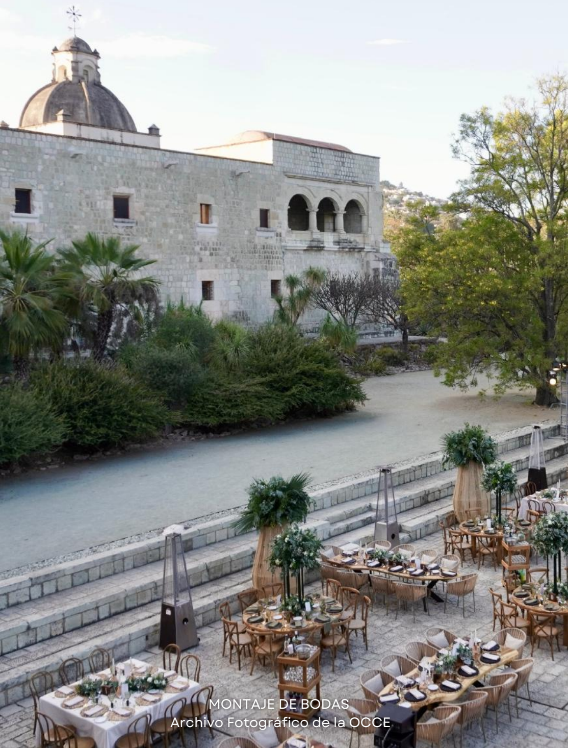
MONTAJE DE BODAS