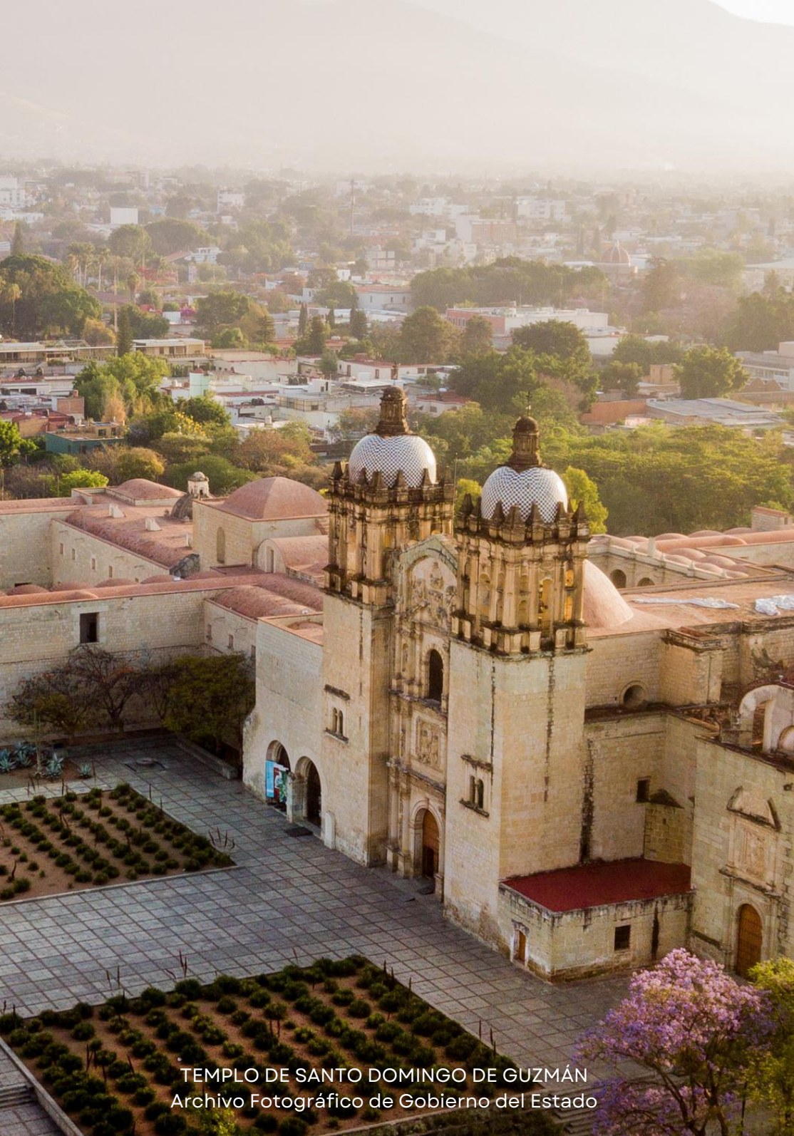
TEMPLO DE SANTO DOMINGO DE GUZMÁN