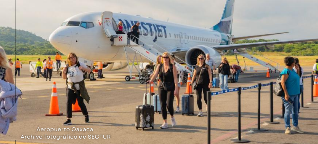
Aeropuerto Oaxaca

Además del Aeropuerto Internacional de Oaxaca, el estado cuenta con tres aeropuertos adicionales que refuerzan su conectividad y facilitan el acceso a diversas regiones.