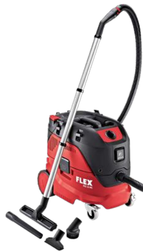
FLEX STØVSUGER VCE 33 LMC 30L 1200W ART.NR: 444.103