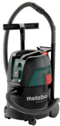
METABO KOMBI STØVSUGER ASA 25L PC ART.NR: PS602014000