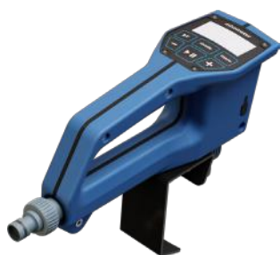
MIXOMETER WATER DOSER ART.NR: W19750