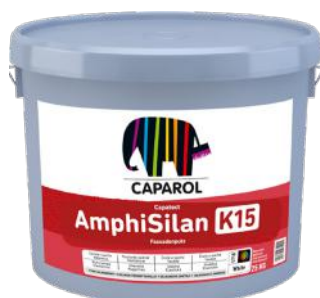
CAPAROL FASADEPUSS AMPHISILAN 25KG KAMPANJEPRIS: 849,-