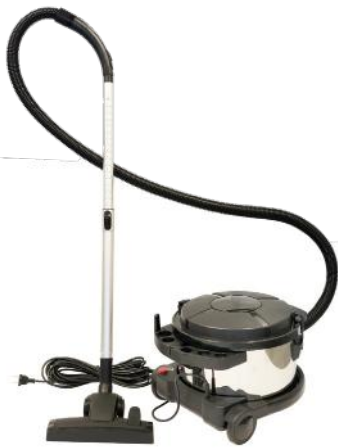
SWENO STØVSUGER 2000GH 800W AMETEK MOTOR ART.NR: 519025