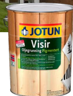
JOTUN VISIR OLJEGRUNNING PIGMENTERT 10L KAMPANJEPRIS: 1 099,-