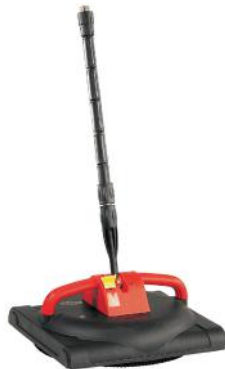
FOMA IPC GULVVASKER 035 210 BAR ART.NR: LCLC49492