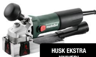
METABO LAKKFRES LF 850 S ART.NR: M601049500