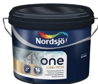
NORDSJÖ ONE SUPER TECH 10L KAMPANJEPRIS: 1 179,-