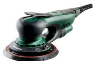
METABO EKSENTERSLIPER SXE 150-5.0 BL METALOC ART.NR: M615050000