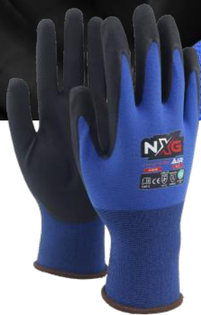
NXG AIR A-8130 MONTERINGSHANSKE

Neste generasjons arbeidshansker for sikkerhet, ytelse og komfort!