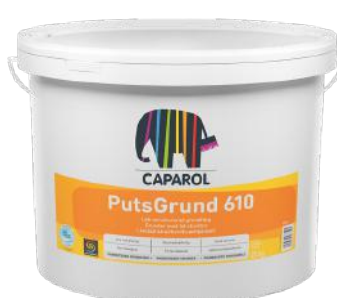
CAPAROL MURGRUNNING 610 25KG KAMPANJEPRIS: 999,-