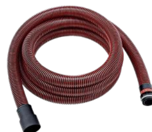
FLEX SLANGE Ø32MM 4M ANTISTATISK TIL GE 5 ART.NR: SWEFLEX406708