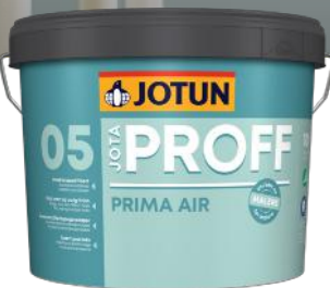
JOTUN JOTAPROFF PRIMA AIR 05 9L KAMPANJEPRIS: 629,-