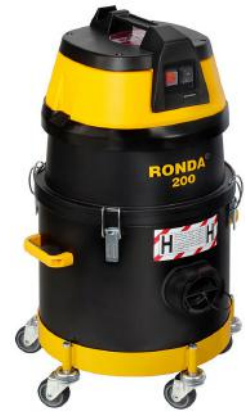
RONDA STØVSUGER 200H SYKLONTYPE 1450W ART.NR: 82060134