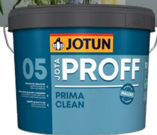
JOTUN JOTAPROFF PRIMA CLEAN 05 9L KAMPANJEPRIS: 929,-