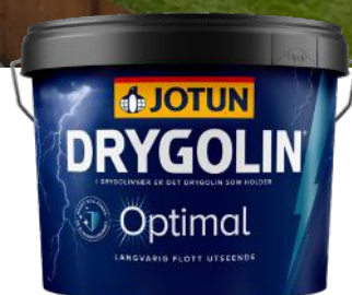
JOTUN DRYGOLIN OPTIMAL 9L KAMPANJEPRIS: 1 249,-