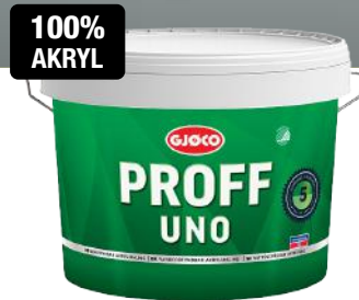
GJØCO PROFF UNO 5 AKRYLMALING 9 LITER KAMPANJEPRIS: 429,-