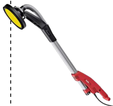
FLEX GIRAFFSLIPER GE 5 SOLO MASKIN ART.NR: F409375