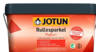
JOTUN RULLESPARKEL MEDIUM UNIVERSAL 10L ART.NR: OM60001897 KAMPANJEPRIS: 329,-