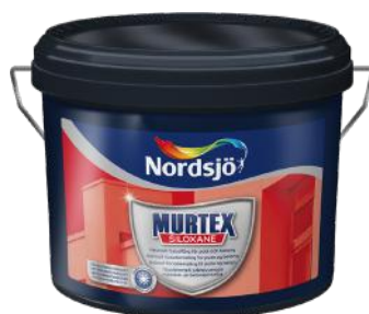
NORDSJÖ MURTEX SILOXANE FASADEMALING 10L KAMPANJEPRIS: 999,-