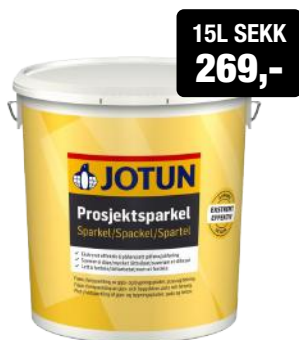
JOTUN PROSJEKTSARKEL SPANN 15L ART.NR: FA184032 KAMPANJEPRIS: 269,-