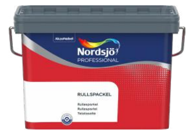
NORDSJØ RULLESPARKEL PRO MEDIUM 15L ART.NR: AN5209172 KAMPANJEPRIS: 349,-