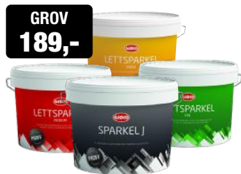
GROV 189,- GJØCO PROFF LETTSPARKEL 10L FIN/MEDIUM/SKJØT KAMPANJEPRIS: 139,-