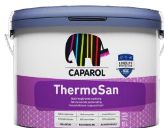
CAPAROL FASADEMALING THERMOSAN 10L KAMPANJEPRIS: 1 099,-