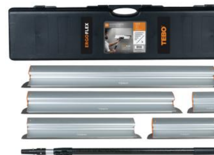
TEBO ERGOFLEX BREDSPARKELSETT ART.NR: B881009 KAMPANJEPRIS: 3 999,-