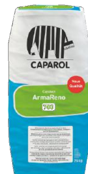
CAPAROL ARMARENO 700 FIBERPUSS 25KG HVIT ART.NR: CA823133 KAMPANJEPRIS: 269,-