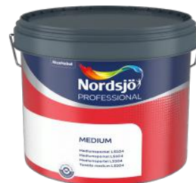
NORDSJØ SPARKEL MEDIUM LS 104 PRO 10L ART.NR: AN5209187 KAMPANJEPRIS: 199,-