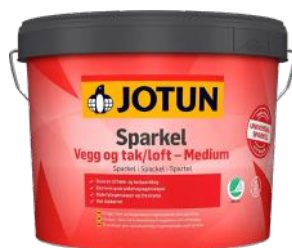
JOTUN SPARKEL VEGG/TAK MEDIUM 10L ART.NR: FA45589838 KAMPANJEPRIS: 199,-