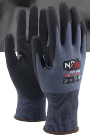
NXG CUT PRO AIR C-9130 KUTTKLASSE D