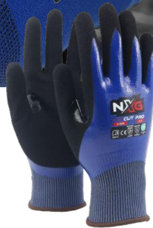
NXG CUT PRO C-5136 KUTTKLASSE D