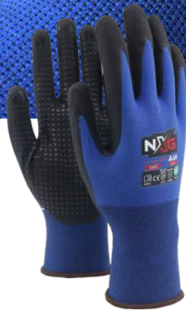
NXG AIR DOT A-8131 MONTERINGSHANSKE