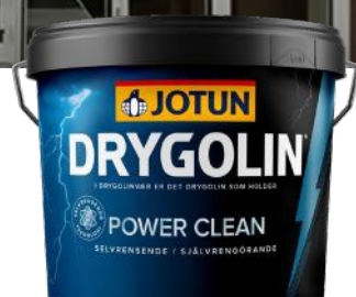
JOTUN DRYGOLIN POWER CLEAN 9L KAMPANJEPRIS: 1 649,-