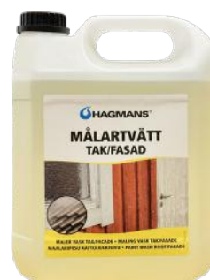
HAGMANS MALERVASK TAK/FASAD 4L ART.NR: HA32012 KAMPANJEPRIS: 399,-