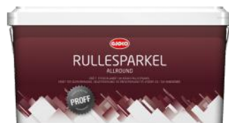
GJØCO PROFF RULLESPARKEL MEDIUM 12L ART.NR: G78792 KAMPANJEPRIS: 249,-