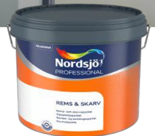
NORDSJØ GIPSPLETSPARKEL PRO 10L ART.NR: AN5240709 KAMPANJEPRIS: 199,-