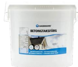
HAGMANS BETONGTAKMALING SORT 10L ART.NR: HA5744 KAMPANJEPRIS: 999,-