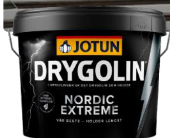
JOTUN DRYGOLIN NORDIC EXTREME 50 9L KAMPANJEPRIS: 1 990,-