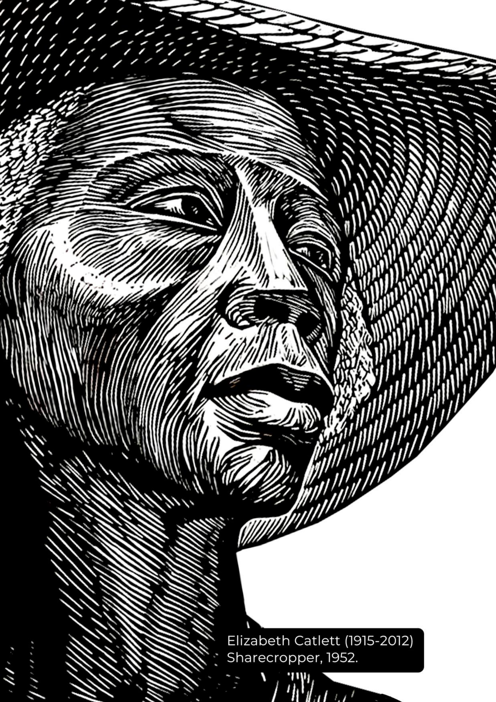
Elizabeth Catlett (1915-2012) Sharecropper, 1952.