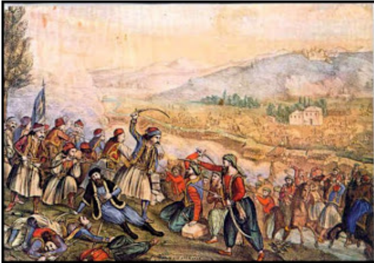
Αλέξανδρος Ησαΐας: Η μάχη της Αλαμάνας