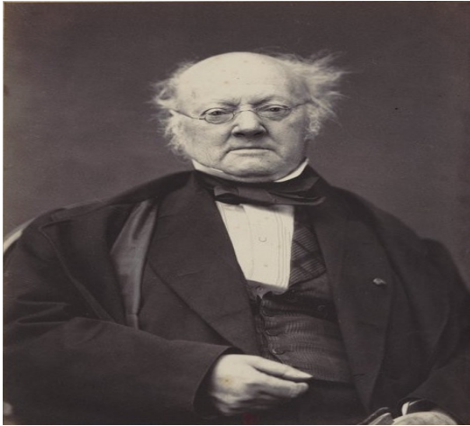
ο καθηγητής της Σορβόνης Abel Francois Villemain