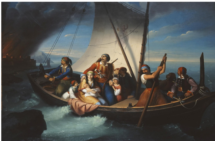
Διον. Τσόκος. Φυγή από την Πάτρα