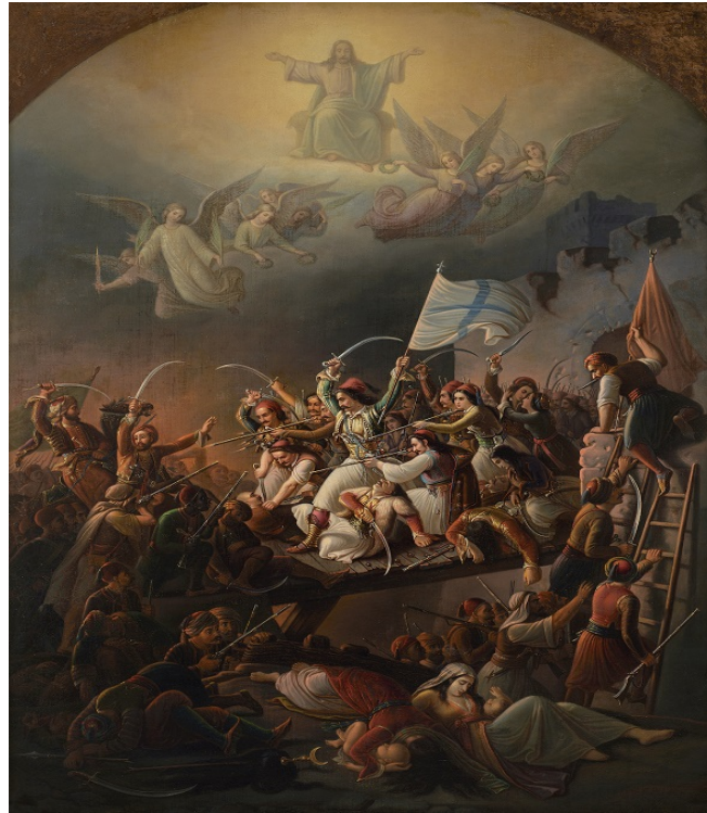
Θεόδ. Βρυζάκης. Η έξοδος του Μεσολογγίου