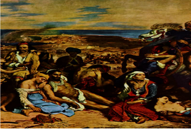
Jean Pelissier: Σκηνή από τη σφαγή της Χίου

Δείγμα της δράσης αλλά και της ύπαρξης αφανών ηρώων, απλών ανθρώπων που ύψωσαν το ανάστημά τους, τόλμησαν να επιλέξουν το θάνατο, πολέμησαν γενναία και πέθαναν, ακολούθησαν το δρόμο της προσφυγιάς και έγιναν «ήρωες» ανακαλύπτουμε και σε πίνακες. Ενδεικτικά παρουσιάζουμε κάποιους!