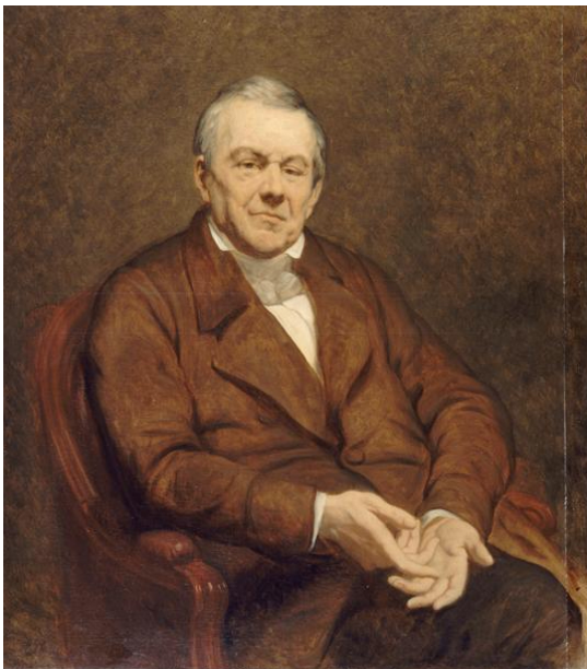
και ο ιδιοκτήτης τυπογραφείων και εκδότης Ambroise Firmin Didot στα τυπογραφεία του οποίου τυπώνονταν τα φιλελληνικά φυλλάδια.

Παράλληλα, γεγονότα που έγιναν γνωστά με πολλές λεπτομέρειες στο εξωτερικό, όπως η σφαγή της Χίου και το έπος του Μεσολογγίου, δημιούργησαν ένα ευρύ κύμα συμπάθειας για τον ελληνικό λαό. Αμέσως, τα φιλελληνικά κομιτάτα του Παρισιού , της Μασσαλίας και της Λυών διοργάνωσαν εράνους για την ενίσχυση των επαναστατημένων Ελλήνων στους οποίους πρωτοστατούσαν προσωπικότητες,