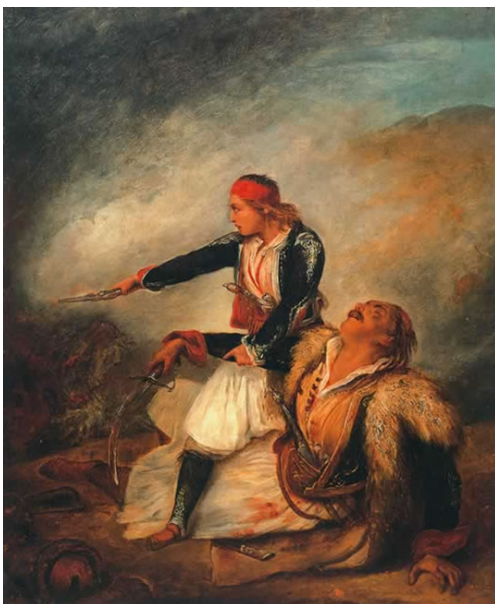
Ary Scheffer : Ο υιός υπερασπίζεται τον θνήσκοντα πατέρα στη μάχη