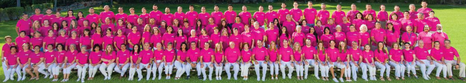
Seminario de Distribuidores 2021. Huatulco, Oaxaca.