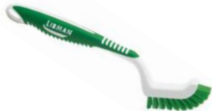
CEPILLO PARA EMBOQUILLADO