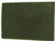
FIBRA VERDE MEDIANA