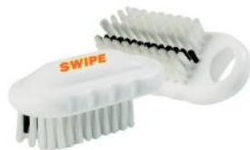
CEPILLO PARA MANOS Y UÑAS