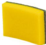
FIBRA VERDE CON ESPONJA