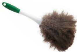
SACUDIDOR DE PLUMAS

Bastón ajustable hasta 2.13m Cabezal flexible 45.7cm