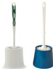
CEPILLOS PARA W.C. C/BASE