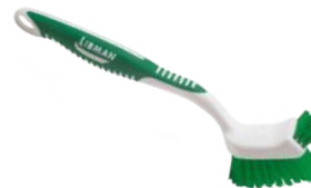
CEPILLO PARA COCINA