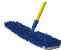
SACUDIDOR DE MICROFIBRA 2 EN 1

Largo: 1.29m Ancho: 42cm Repuesto de microfibra