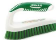
CEPILLO TIPO PLANCHA