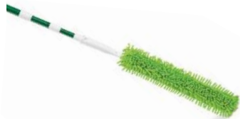
SACUDIDOR ABANICO DE TECHO

Bastón ajustable hasta 2.13m Cabezal flexible 45.7cm