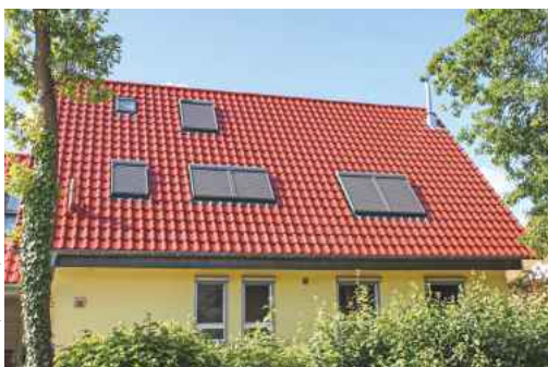
Ein gut gedämmtes Dach und außen liegender Sonnenschutz an den Dachfenstern sind der beste Schutz vor steigenden sommerlichen Spitzentemperaturen.

(djd) Bei der Modernisierung von Wohngebäuden rückt angesichts häufiger auftretender Hitzewellen neben der Heizkosteneinsparung immer stärker auch der Schutz vor sommerlicher Überhitzung in den Fokus. Gerade Dachgeschosse gelten als sensible Bereiche, da sich bei Sonne auf den Dachflächen Temperaturen von 70 Grad und mehr entwickeln können. Wirksamen Schutz bietet eine durchgehende Aufsparrendämmung aus Hochleistungsdämmstoffen wie Polyurethan (PU), die eine nahezu wärmebrückenfreie Dämmschicht bildet. Noch besser wirkt der sommerliche Wärmeschutz, wenn er mit außen liegenden Verschattungen wie Raffstores, Rollläden oder Markisen an den Fenstern kombiniert wird.