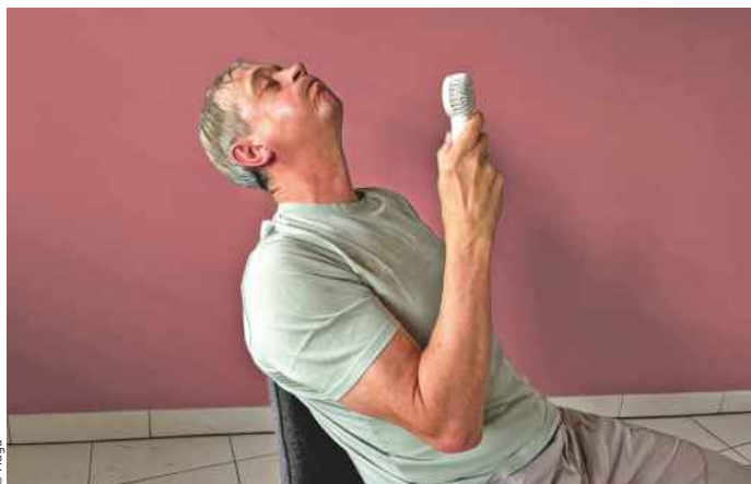
Im Sommer heizt sich manche Wohnung unerträglich auf. Dunkle und versiegelnde Wandoberflächen verschlimmern den Effekt noch.

Auch die berüchtigte Schwüle macht der sorptionsfähige Kalkputz erträglicher. Er saugt die Feuchtigkeit der schwülen Luft wie ein Löschblatt auf und hält die Luftfeuchtigkeit im Raum spürbar niedriger als draußen. Experten raten, auf helle Wandgestaltungen und den sogenannten Albedo-Effekt (von lateinisch „albus“ für Weiß) zu setzen. Dunkle Oberflächen wandeln Sonnenlicht in reine Wärmeenergie um. Weiße oder sehr helle Wände dagegen reflektieren bis zu 85 % des einfallenden Lichts, ohne sich selbst nennenswert zu erwärmen. Je höher der Kalkanteil, desto strahlender das Weiß und desto größer der Albedo-Effekt. Informationen zu Naturkalk unter haganatur.de