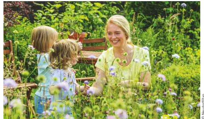
Sonne, flatternde Schmetterlinge und summende Bienen: Eine Wildblumenwiese holt die Natur zurück in den eigenen Garten. Das unterstützt die Artenvielfalt und bietet vielen nützlichen Insekten Nahrung.

Allein deswegen lohnt es sich, über eine Wildwiese im eigenen Garten nachzudenken. Denn die insektenfreundlichen Pflanzen sind echte Naturschützer. Die Fläche muss nicht groß sein, einige Quadratmeter reichen aus. Der Aufwand ist geringer als viele vermuten. Denn es gibt mehrjährige Samen-Mischungen mit heimischen Wildblumen und -kräutern, beispielsweise