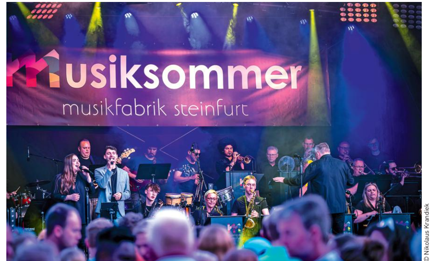
Schon beim Musiksommer 2026 überzeugte die Big Band der Musikfabrik mit ihrem musikalischen Talent.

Auf dem abwechslungsreichen Programm stehen Titel von Phil Collins, Stevie Wonder, Michael Bublé oder Aretha Franklin genauso wie Titel der Bands „Meute“ und „Elektro Deluxe“. Beide Konzerte starten um 20 Uhr und der Eintritt beträgt 10 Euro.