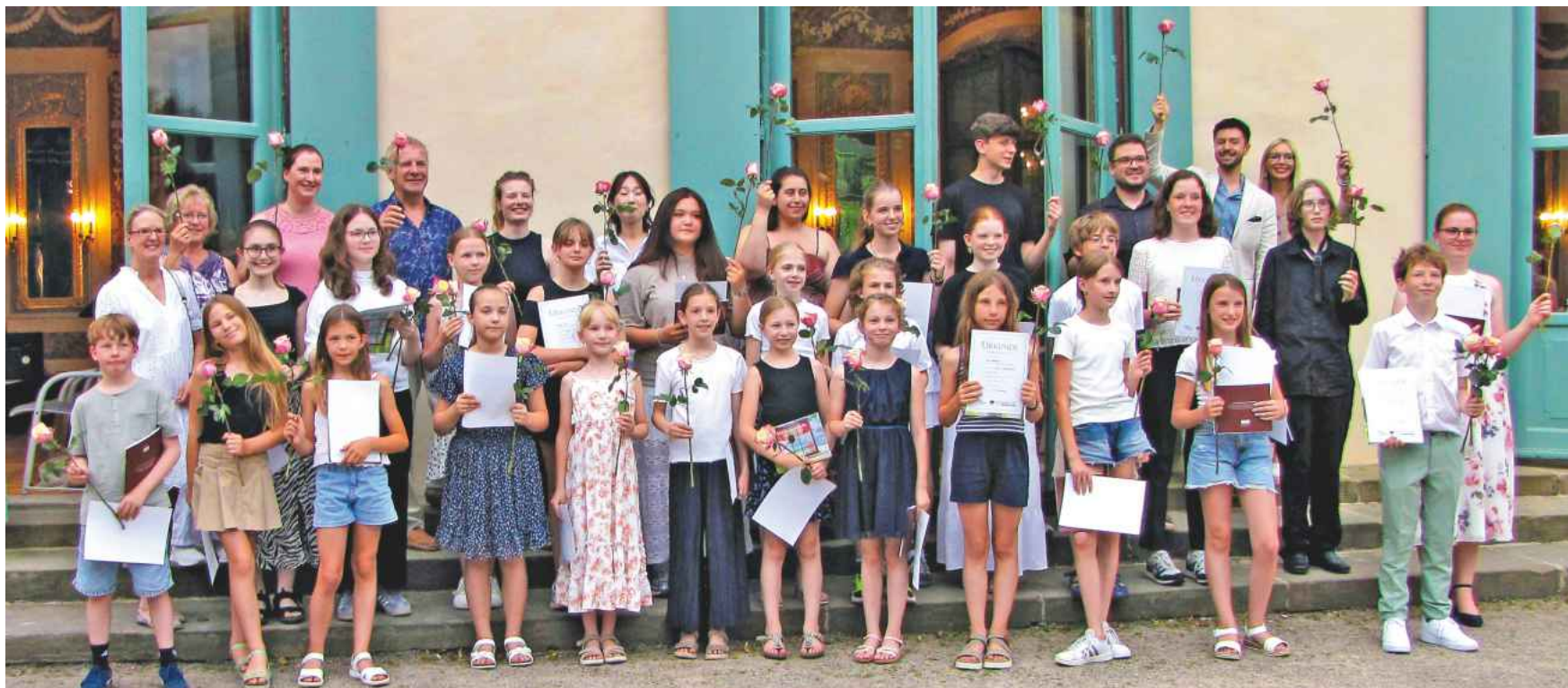
Trotz hoher Temperaturen boten die jungen Musikerinnen und Musiker einige beeindruckende Beiträge.

(hak) Steinfurt. Zum fünften Mal in Folge hat die Musikschule im KulturForumSteinfurt ihren Musikschulwettbewerb, den Tecklenborg Förderpreis durchgeführt. Unterstützt vom gleichnamigen Druck- und