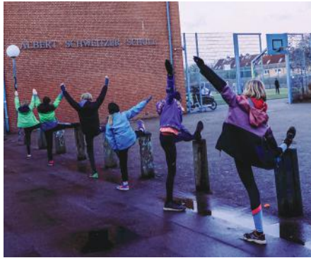
Ehe die Kinder zur entspannten Runde Ausdauerlauf durchs schöne Alstertal starten, wird sich erstmal aufgewärmt

Wer Lust hat bei der Leichtathletik mitzumachen, ist herzlich willkommen! Die Kinder freuen sich sehr über neue Trainings-Kameraden! Auch wenn Ihr Fragen habt, meldet Euch gern und schreibt eine Email an: leichtathletik@HTB62.de • jb