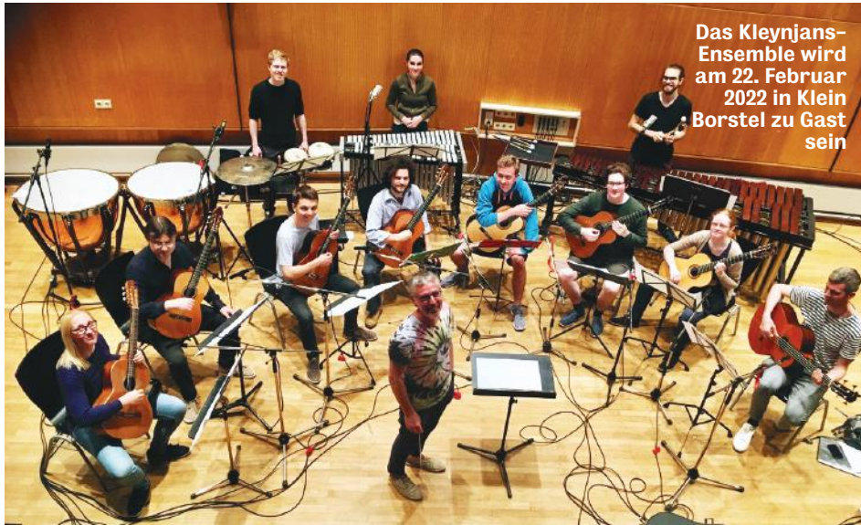
Das Kleynjans-Ensemble wird am 22. Februar 2022 in Klein Borstel zu Gast sein