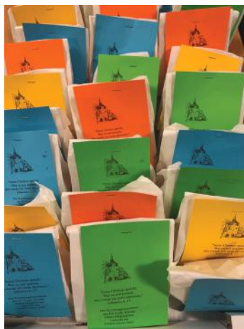
Berliner to go statt Neujahrsempfang – aufgrund der Pandemie musste der Empfang in der Kirchengemeinde kurzfristig ausfallen