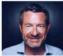
Kai Diekmann Gründer Storymachine und ehem. Chefredakteur BILD